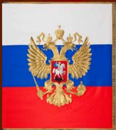
Штандарт президента России