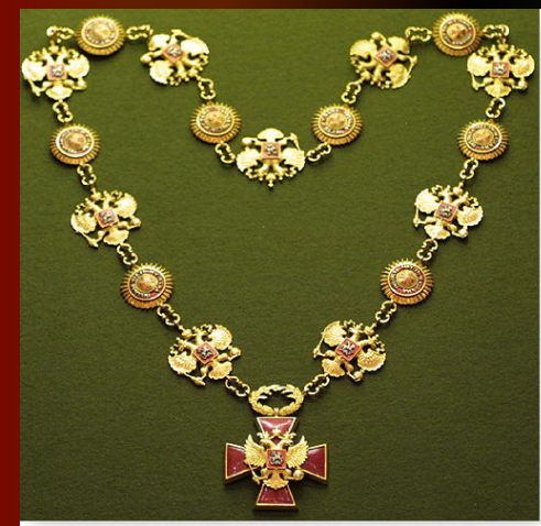
Знак президента России