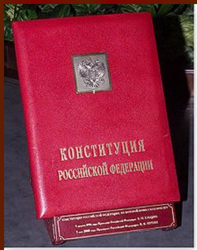
Специальный экземпляр Конституции России