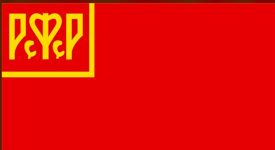
Флаг РСФСР 1918 года.