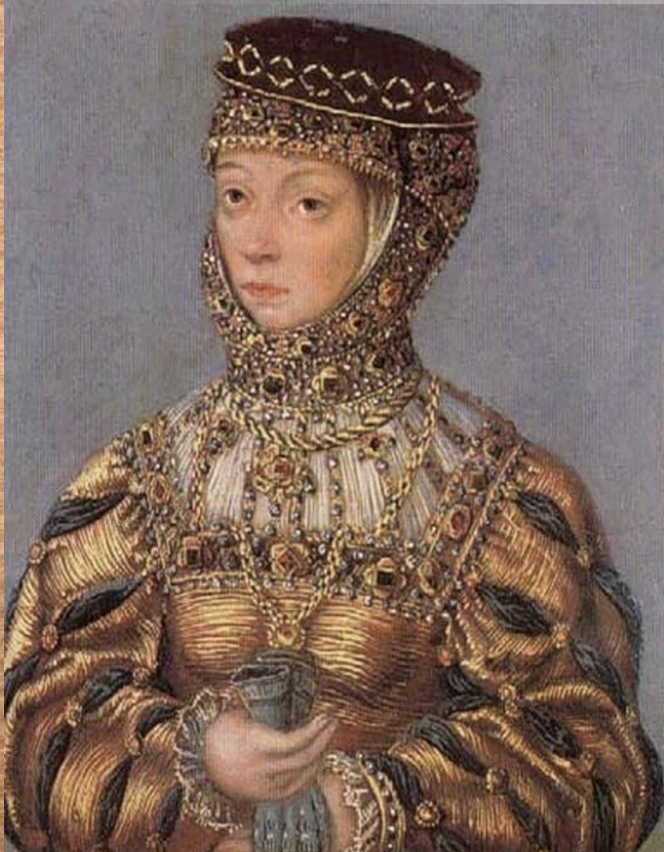
Барбара Радзівіл (1520 г.)