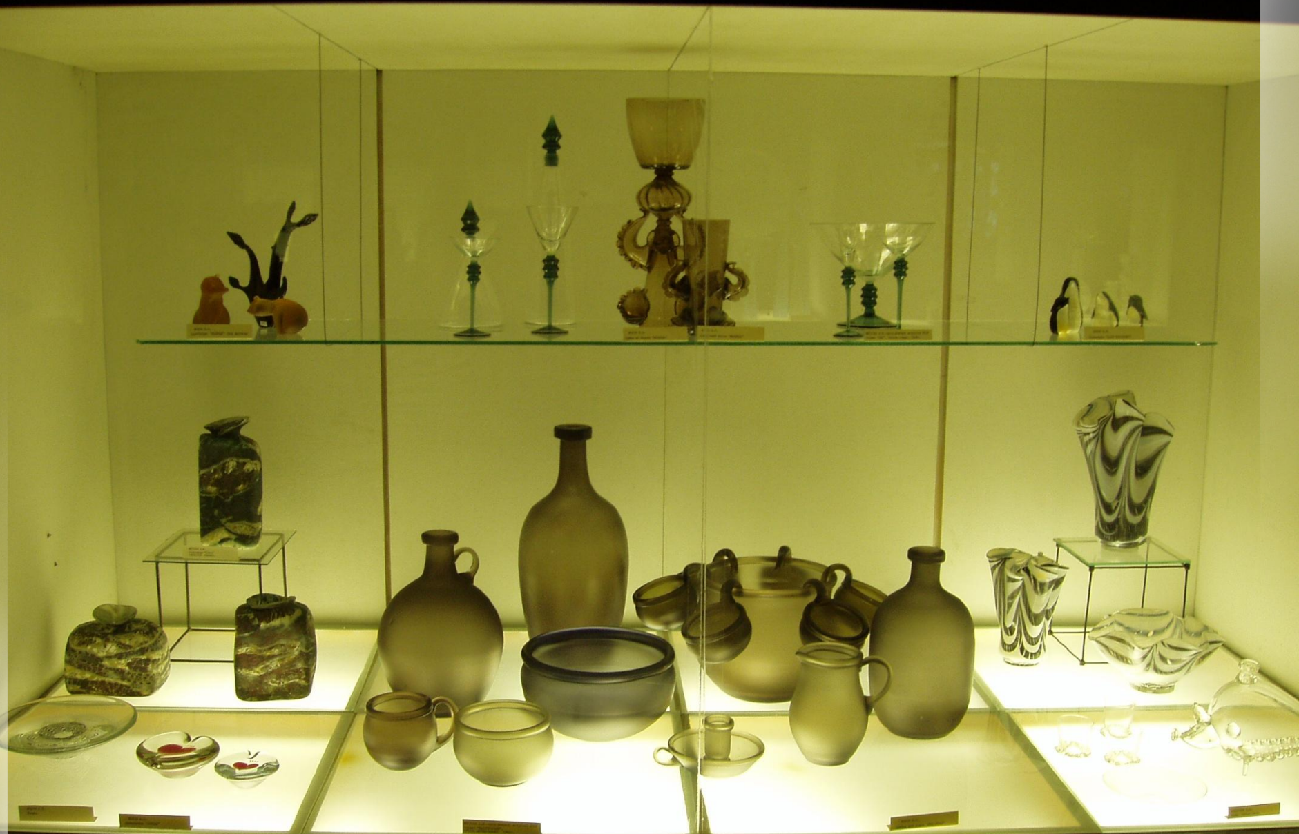
Вырабы сучасных майстроў-гутнікаў. Шклозавод «Нёман».