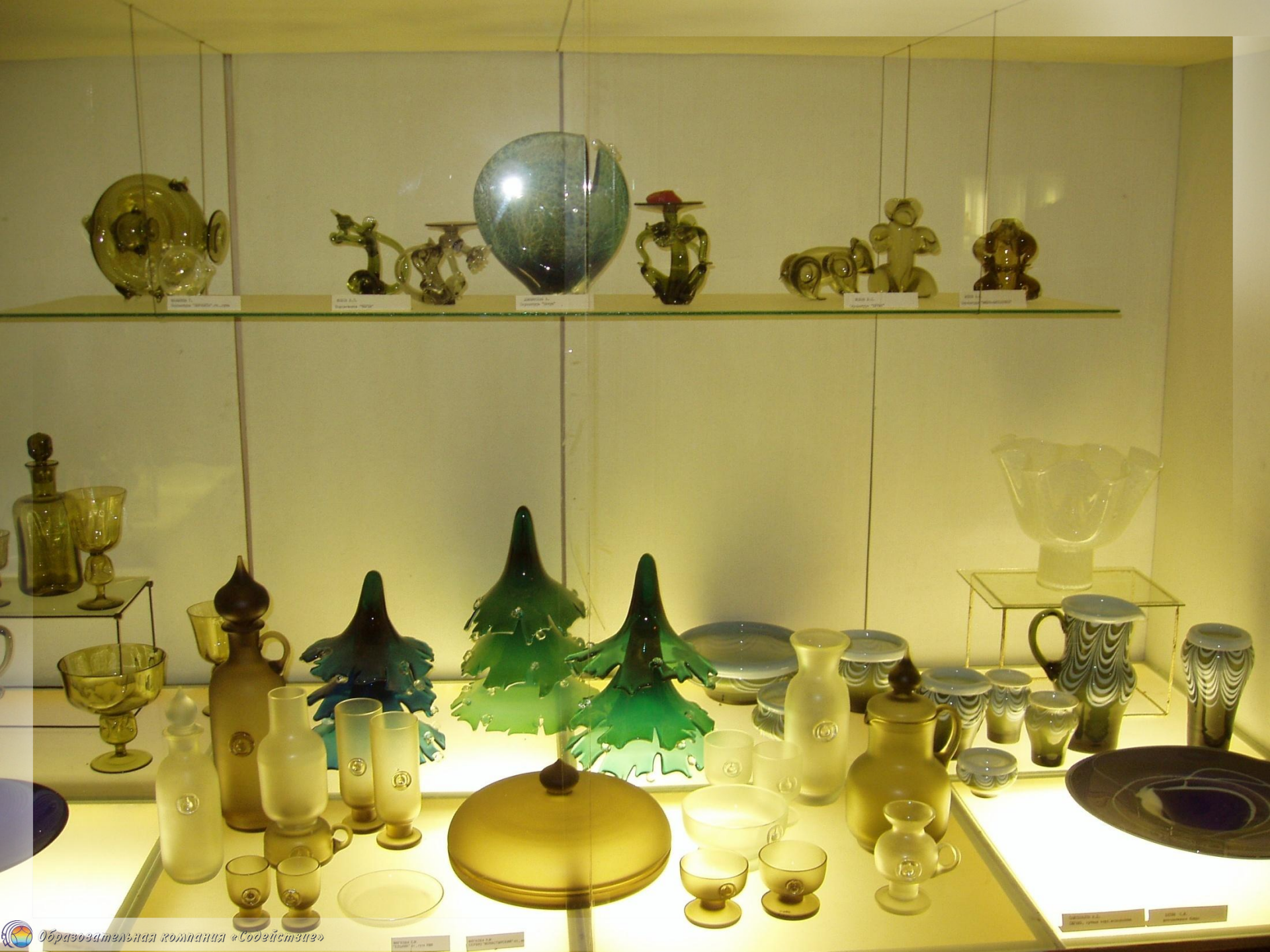
ВАЗА С.С. КОЛОДКИН «СЕРДЦЕ»