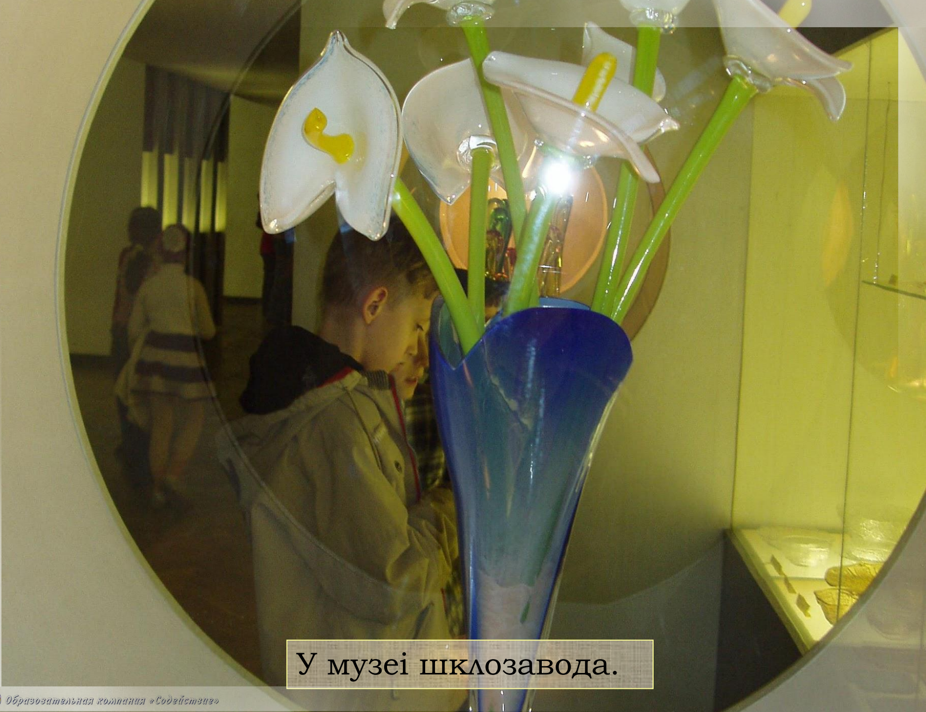
У музеї шклозавода.