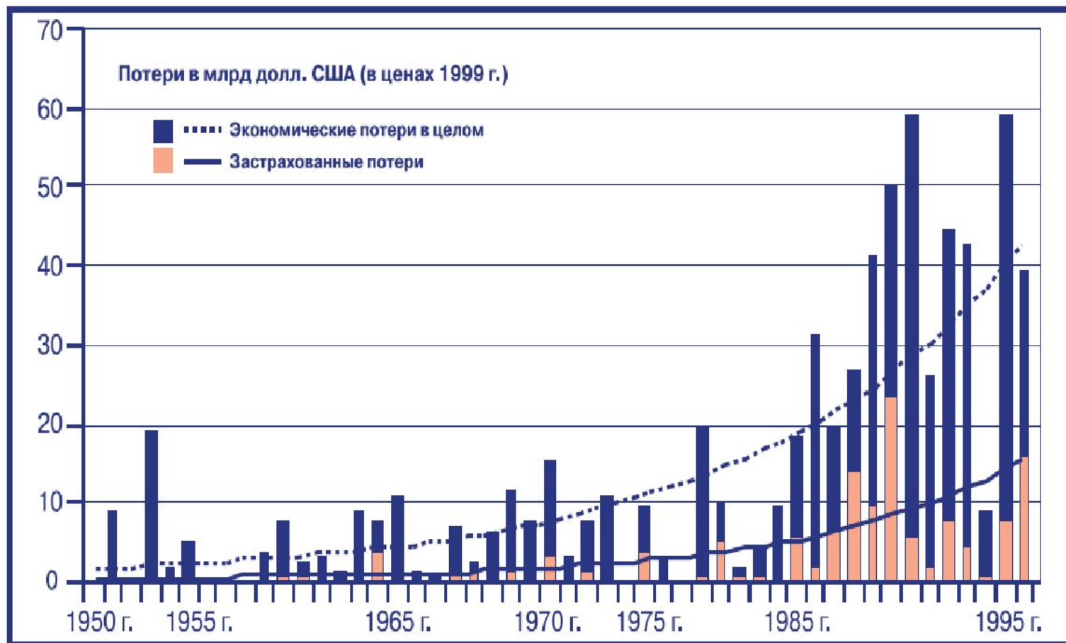
Рис. 7. Рост ущерба от неблагоприятных природных явлений. Число событий, связанных с погодой, возросло более чем в 5 раз (72 – в 1940–1944 гг., 13 и 16 – в 1950-е 1960-е годы, 29 и 44 – в 1970-е и 1980-е). При этом не наблюдается рост числа событий, не связанных с погодой: 17 – в 1990-е, 19 – в 1980-е, 18 – в 1970-е (МГЭИК, 2001).