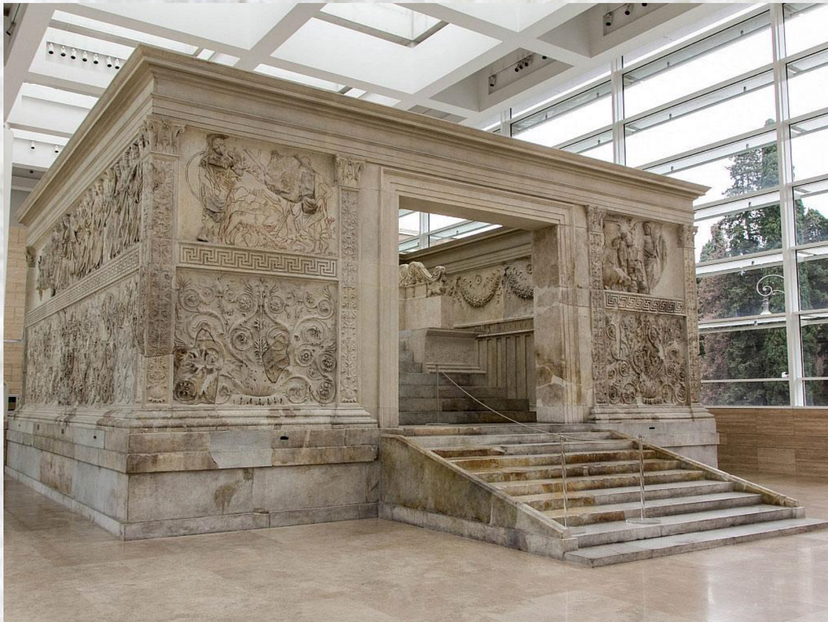
Алтарь мира Августа