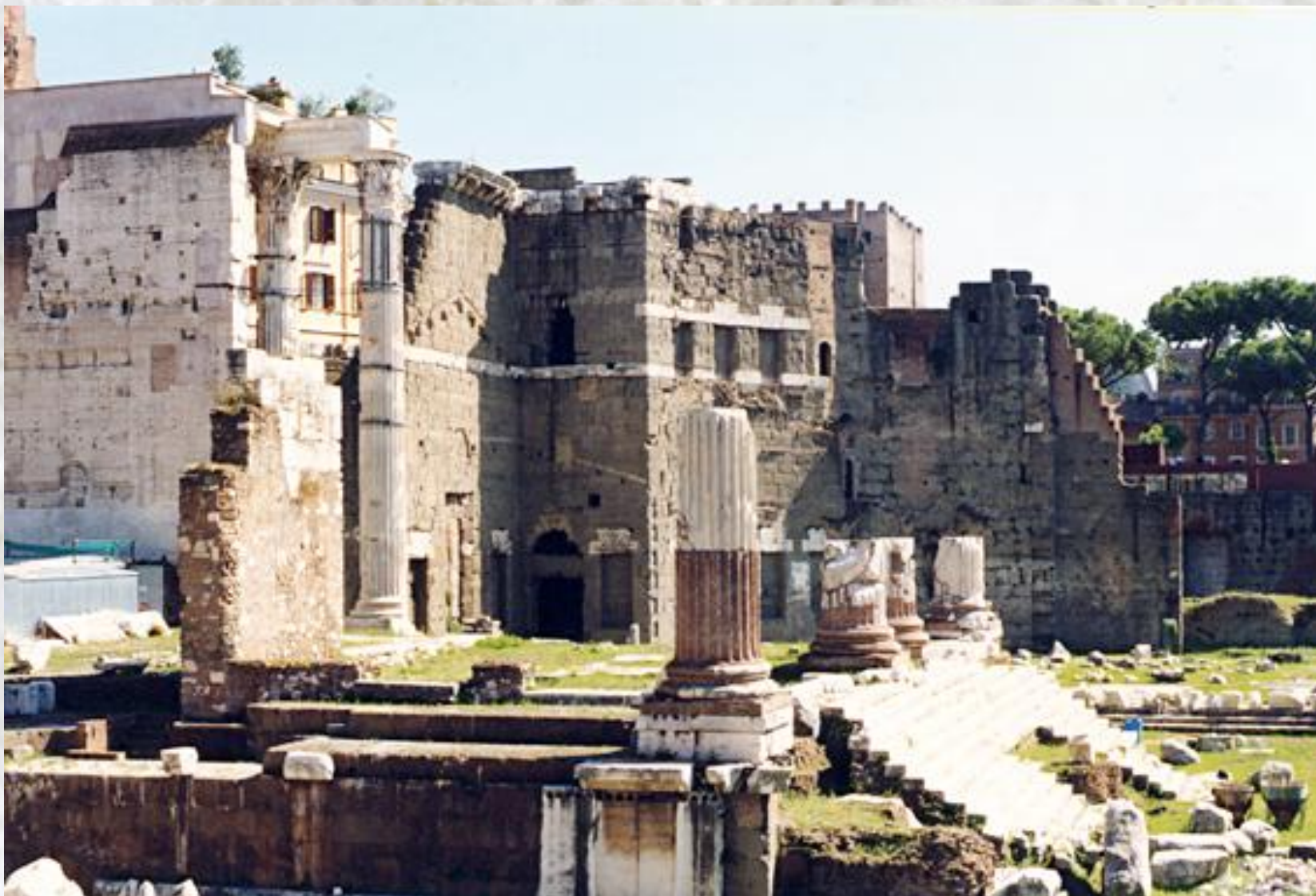
Храм Марса Ультора