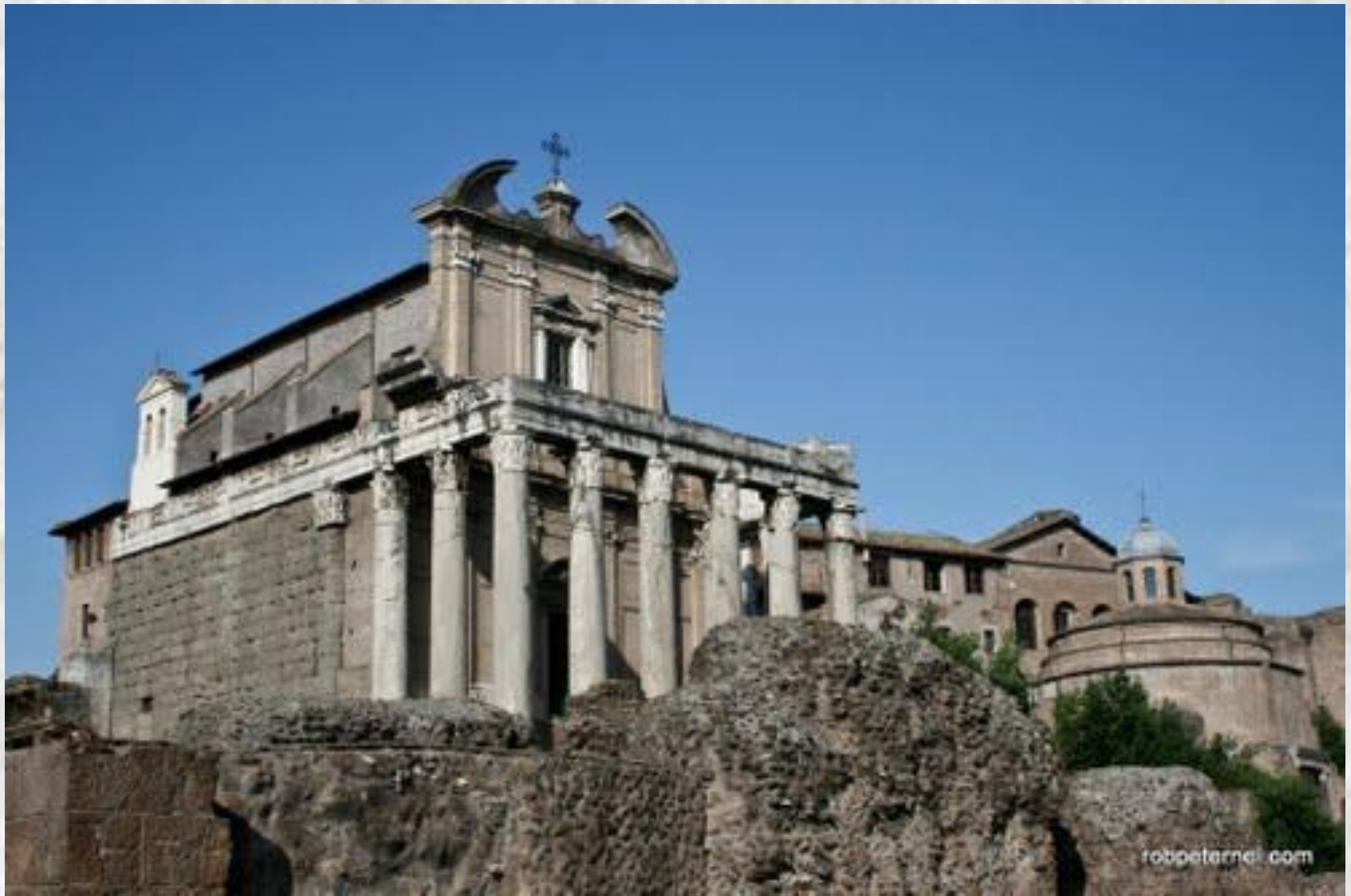
Храм божественного Юлия