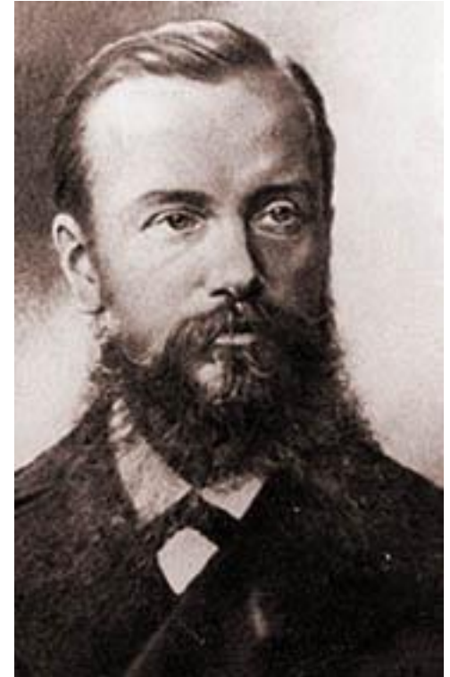
▣ Архітектор: Володимир Ніколаєв