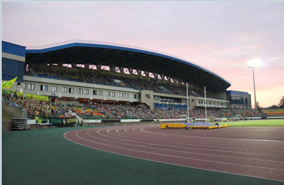
Спорткомплекс «Неман» в Гродно