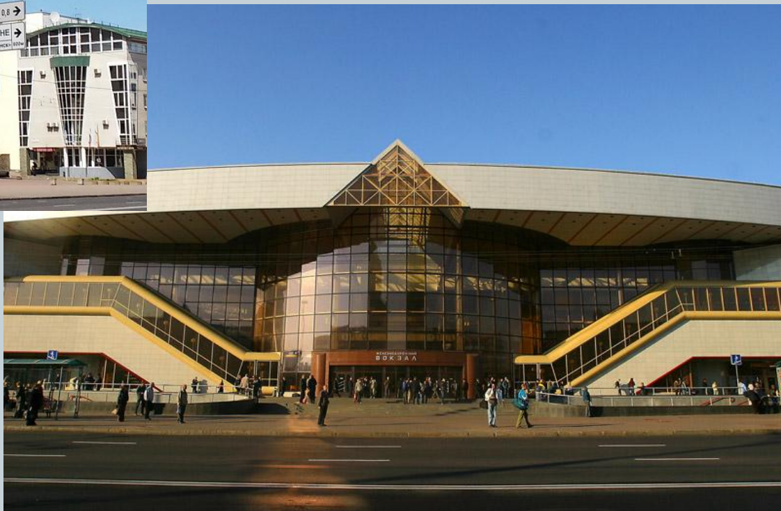
ЖД вокзал Минска, станция Минск- Пассажирский