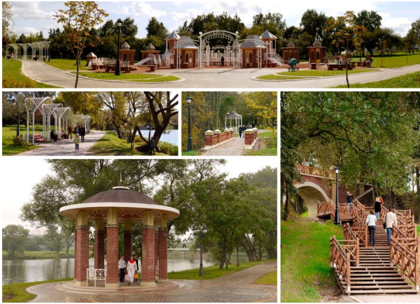
Реконструкция Лошицкого усадебно-паркового комплекса в г. Минске

Ландшафт для современной цивилизации не роскошь, а жизненная необходимость. Недостаточно, если пейзаж просто радует глаз и доставляет удовольствие. Задача гораздо сложнее – необходимо выразить скрытый в глубинах подсознания «второй» неведомый мир.