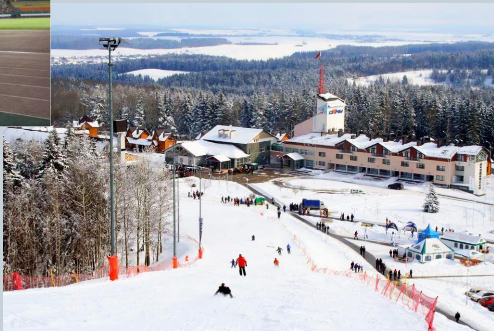
Республиканский горнолыжный курорт «Силичи»