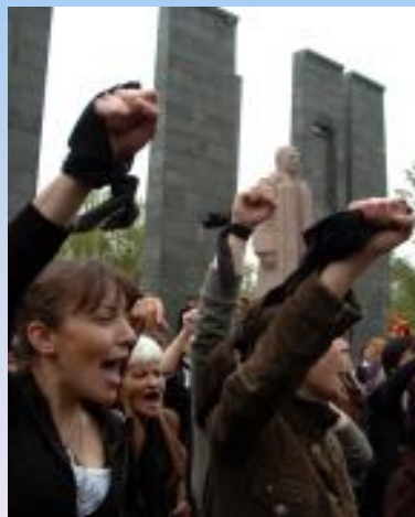
Армянская оппозиция в Ереване (2008)

1—2 марта произошли погромы и столкновения митингующих с полицией, в результате которых 10 человек погибли, 265 пострадали. В интервью «Российской газете» Серж Саркисян охарактеризовал произошедшее как попытку цветной революции. Участники беспорядков, в их числе оппозиционные политики, были арестованы, пятеро из них позже осуждены на один и три года лишения свободы.