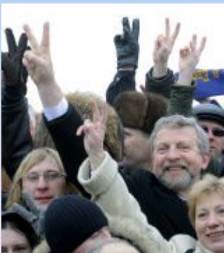
Оппозиционер Александр Милинкевич (2006)

Проигравшая оппозиция, возглавляемая экс-кандидатами в президенты Александром Милинкевичем и Александром Козулиным, организовала относительно массовые (от трёхсот до нескольких тысяч человек) митинги и акции протеста, а на Октябрьской площади в Минске появился палаточный городок. Требования проигравших кандидатов признать результаты выборов недействительными были отклонены ЦИК. 24 марта милиция арестовала участников акции, демонтировала палатки. Попытка революции не удалась.