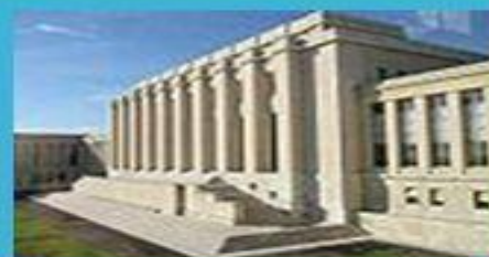
Здание ООН в Женеве