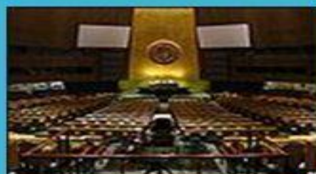
Зал Генеральной Ассамблеи ООН