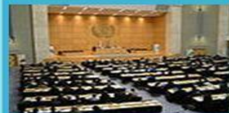
Главный зал ООН в Женеве