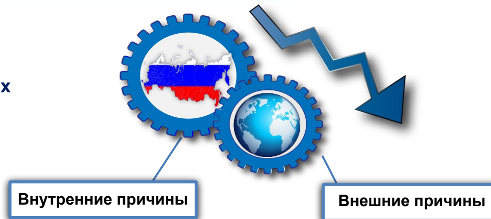
Вклад в прирост инвестиций в основной капитал