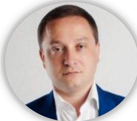
Худяков Роман Иванович – Кандидат в Президенты РФ 2018 г, Депутат ГД РФ