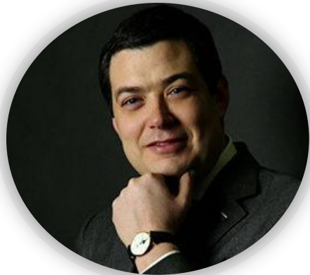
Михальченко Евгений Олегович – Администрация Президента РФ