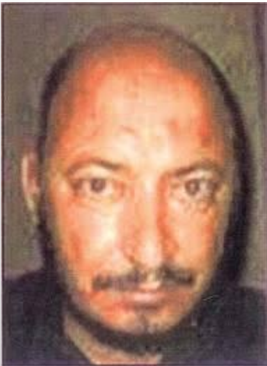
Абу Умар аль-Багдади

В апреле 2010 года в результате авиаудара были ликвидированы два лидера ИГИЛ — Абу Умар аль-Багдади и преемник Заркави египтянин Абу-Айюб аль-Масри. Новым лидером (министром обороны) стал марокканец Ан-Насер Лидинилла Абу Сулейман. После гибели Абу Умара заявления об акциях организации делаются от имени Абу Бакра аль-Багдади. Согласно сообщению СМИ в мае 2015 года Абу Бакр аль-Багдади был парализован в ния в позвоночник.