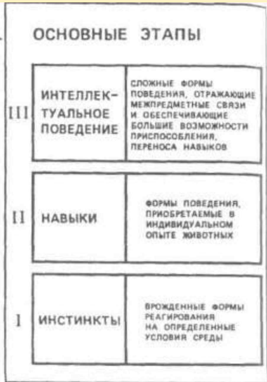
Рис. III.8. Развитие форм поведения в филогенезе