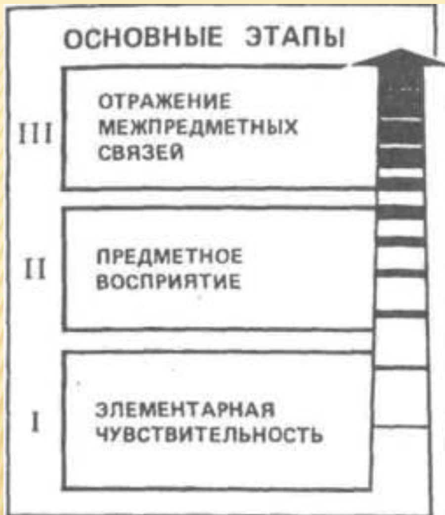
Рис. III.7. Основные этапы развития психики в животном мире