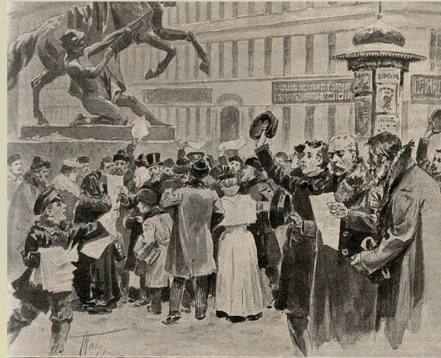
Маневр манифеста 28-го января в Петербурге, у Анничкова моста. Ориг. рис. (собств. «Нивы») В. А. Табурина, авт. «Нивы»

Характер войны: несправедливый, захватнический со стороны всех её участников