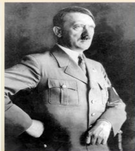
Адольф Гитлер MyShare