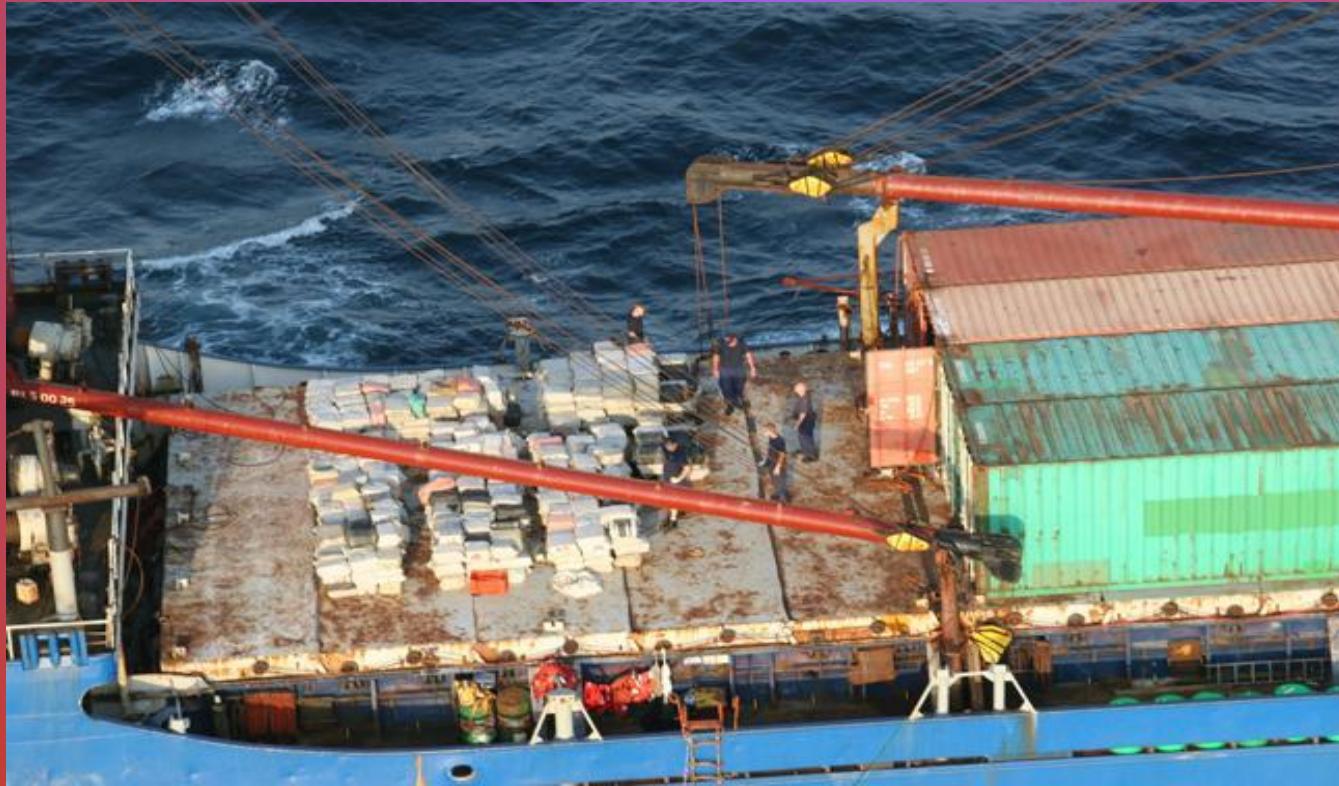
Zatrzymanie statku u wybrzeży Panamy, na pokładzie 20 ton kokainy