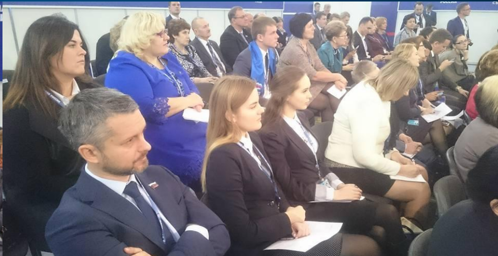
«Умная сила и культурное лидерство»