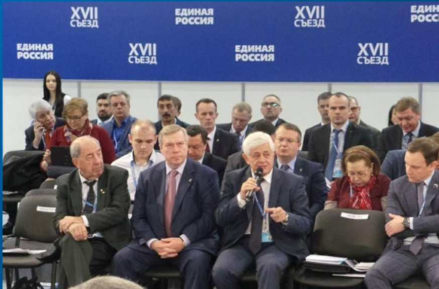
«БЫТЬ ХОЗЯИНОМ В СОБСТВЕННОМ ДОМЕ»