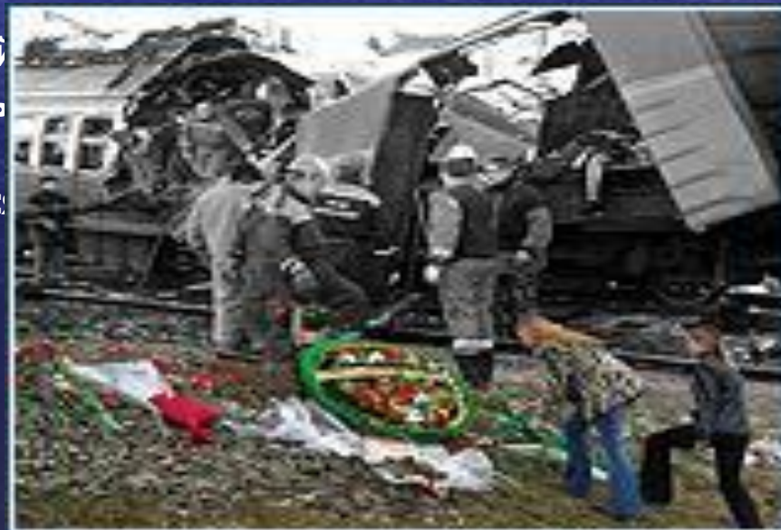
Теракт под Кисловодском. 5 декабря 2003 года.