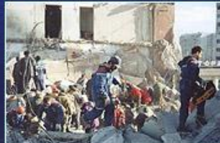
Взрыв дома в Каспийске