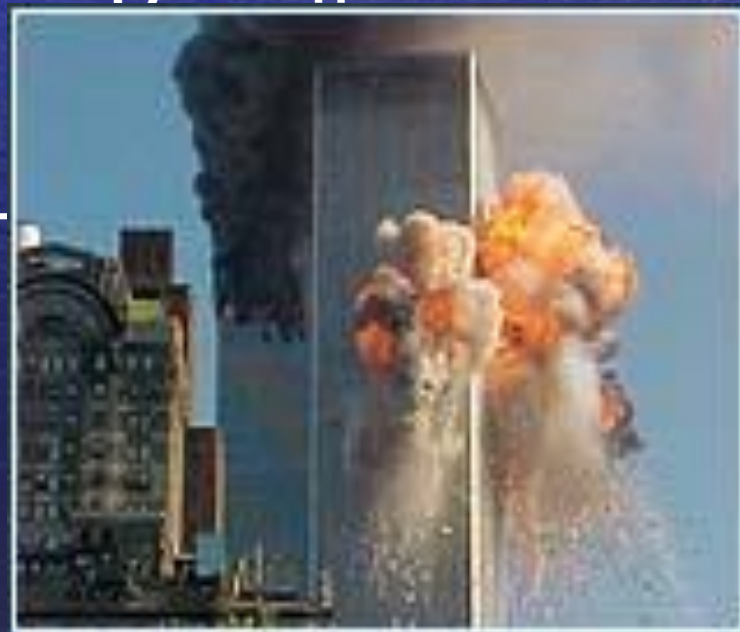
Взрывы международного торгового центра. Нью-Йорк. 11 сентября 2001 года.