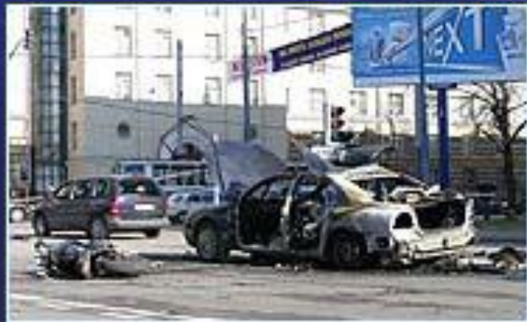
Подрыв автомобиля в Москве