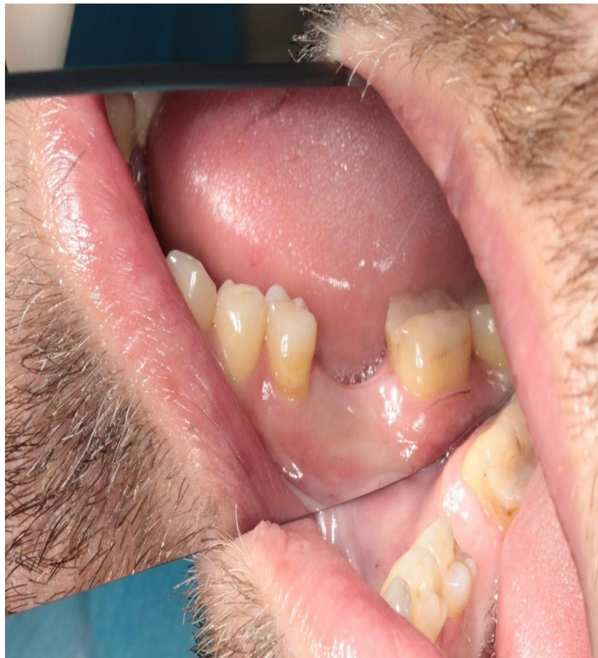
Зона отсутствующего зуба.