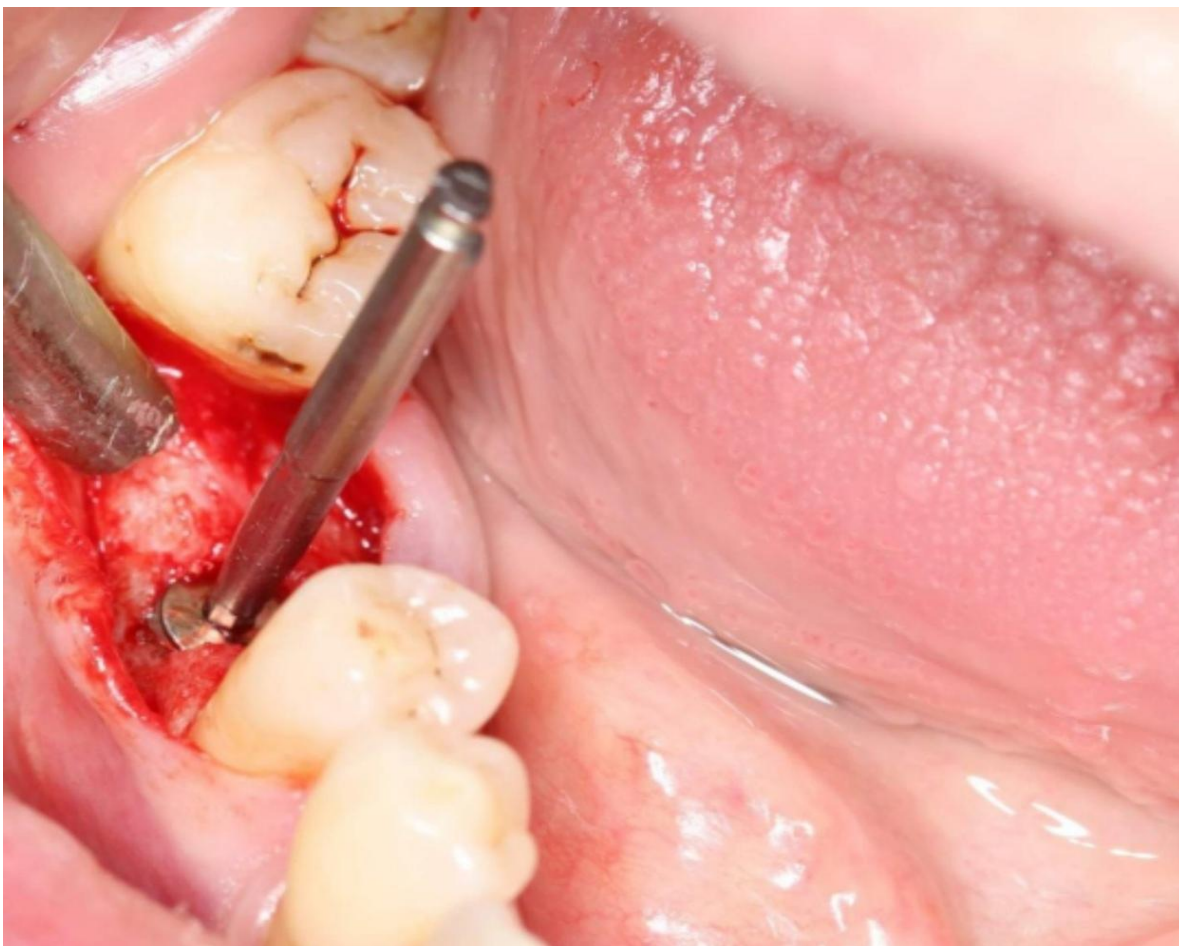
Установлен имплантат с торком 20нсм