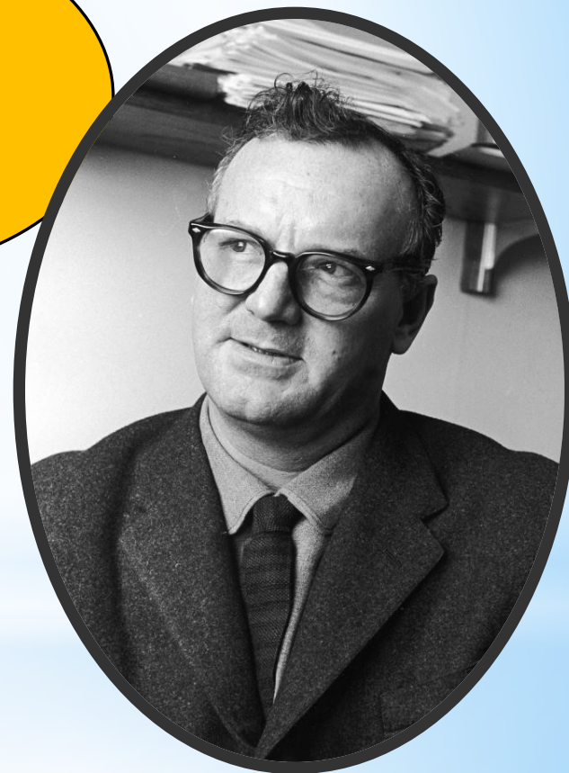
Чарльз Райт Миллс