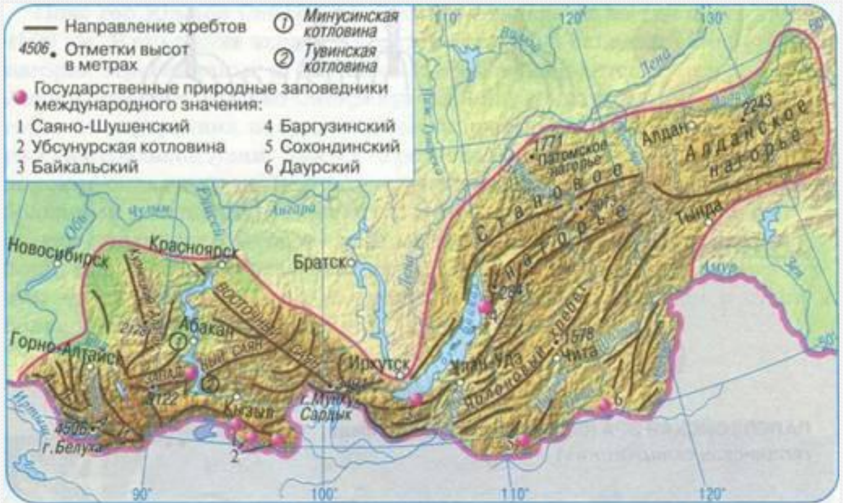
Рис. 211. Орографическая схема Южной Сибири