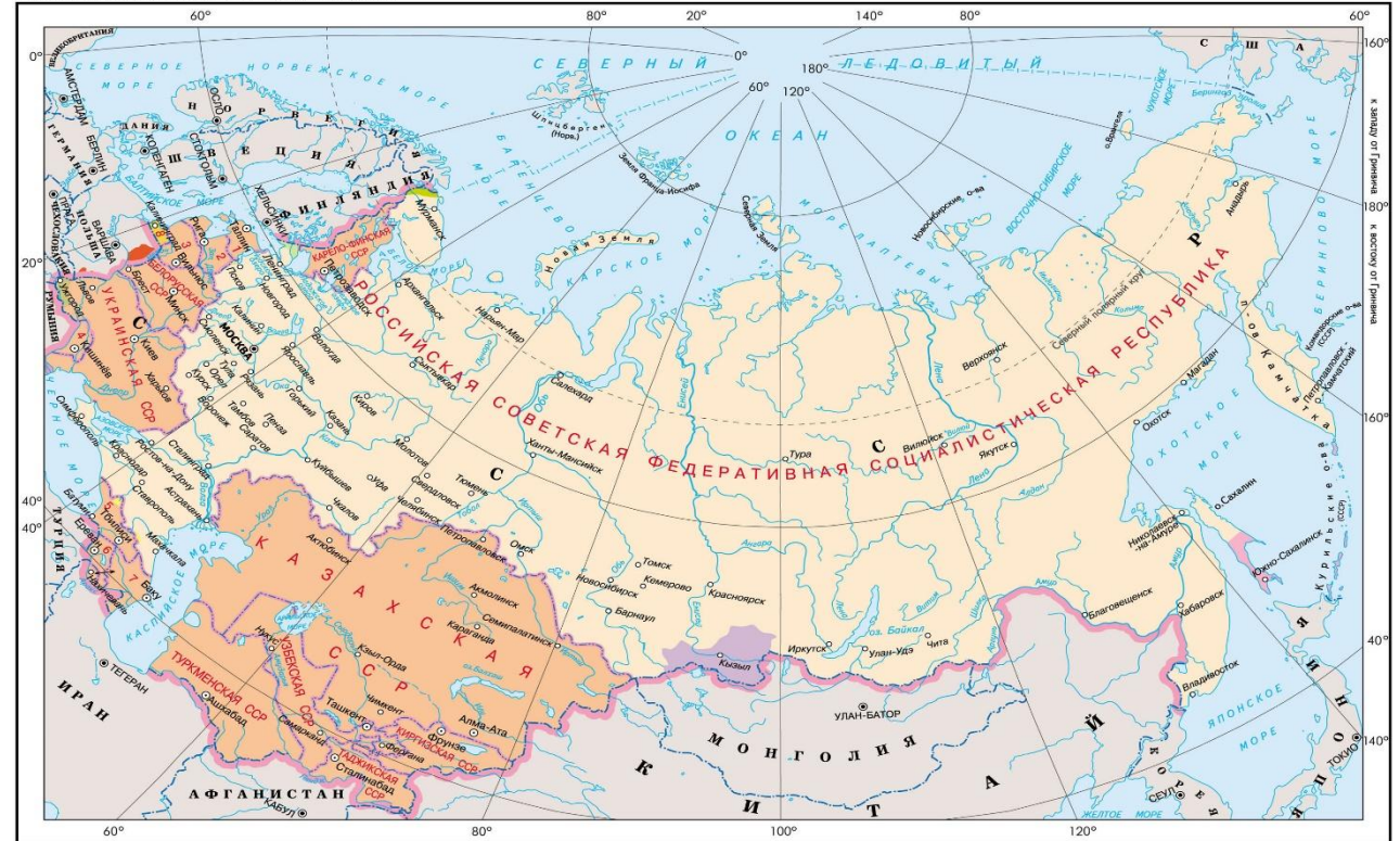
Масштаб 1:32 000 000

Территория РСФСР по состоянию на 31 декабря 1940 г.