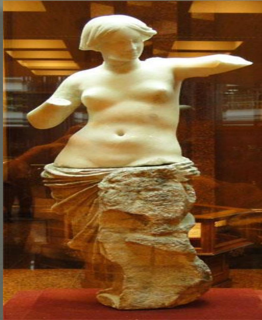
II Митридиаттың қызы-Родогунның мүсіні