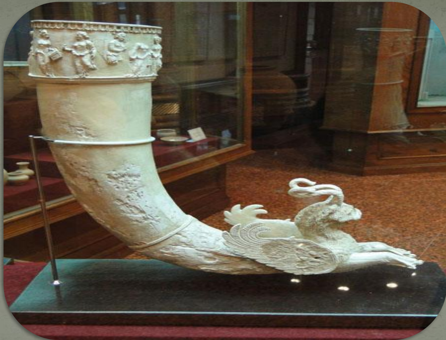
Піл сүйегінен жасалған қанатты сфинкс