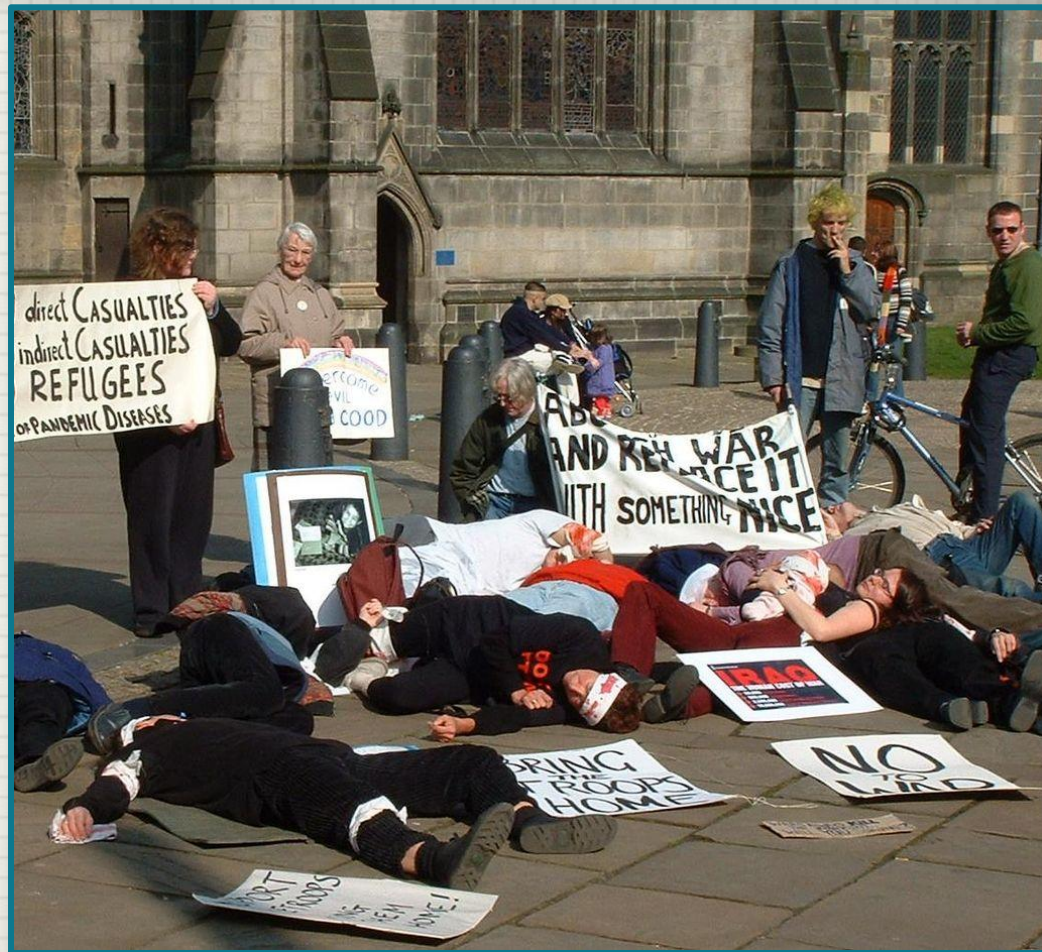
Антивоенная демонстрация на акции против вторжения в Ирак в 2003 г. Великобритания.

Современный паци-физм, получивший особенное раз-витие после Первой мировой вой-ны и обогащённый опытом кампа-ний ненасильственной борьбы, ко-торые проводили М.Ганди и М.Л. Кинг, настаивает на необходимос-ти активного сопротивления, но без использования уничтожающей силы.