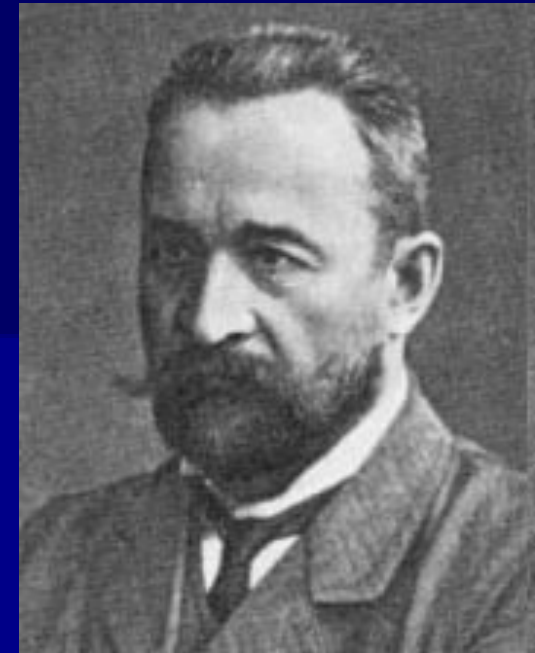
Князь Георгий Евгеньевич Львов