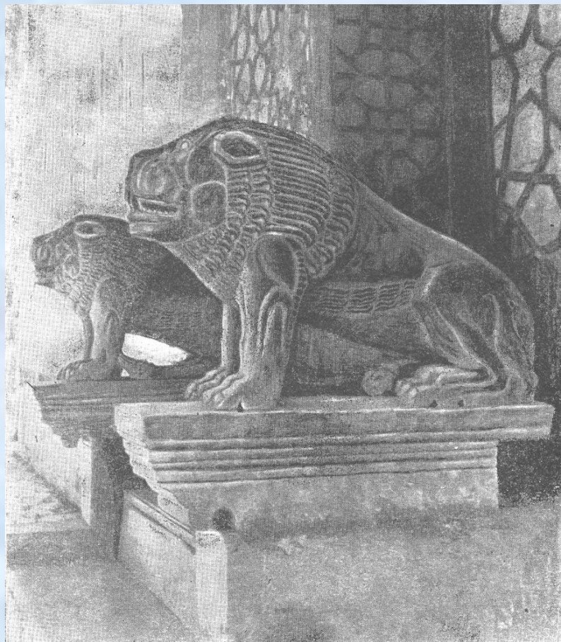
Львы у входа во дворец Ситораи Махи- хоса. Бухара