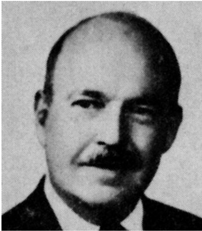
Парсонс Толкотт (1902—1979),

Один из ведущих американских социологов-теоретиков. Помимо разработки общесоциологических категорий занимался анализом вопросов культуры. В работе «Социальная система» (1951) анализировал место и роль культуры в легитимном социальном порядке. Оба явления автономны, но тесно связаны с социальной структурой. Социальная система включает социальную структуру и три другие подсистемы, которые функционально интегрированы между собой, но одной из которых является культурная подсистема. Каждая из трех подсистем выполняет собственную важную функцию. Например, экономическая выступает основой приспособления к окружающей среде, а семейная — обеспечивает социализацию и заботу о детях, интегрируя их в общественное целое.