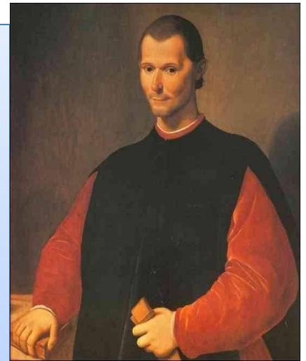
Никколо Макиавелли (1469—1527) итальянский мыслитель

И в наше время есть политические деятели, которые, рисуя светлый образ провозглашаемых целей, оправдывают использование для их достижения лжи, материалов, компрометирующих оппонентов, и иных совсем не благих средств.