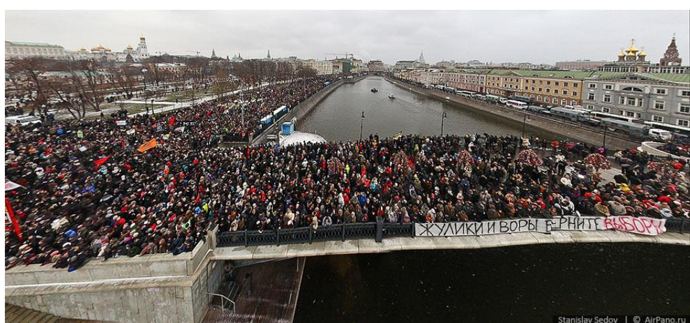
Выступление на Болотной (Россия)