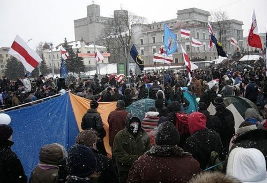
Васильковская революция (Белоруссия)