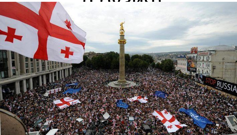
Революция роз (Грузия)