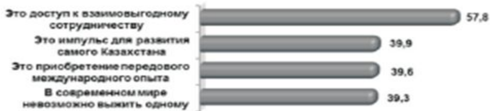
Рис. 4. Причины необходимости участия Казахстана в интеграционных союзах (в %)

Интеграционные проекты Казахстана через призму общественного мнения (по результатам социологического исследования, сентябрь 2012 г.)