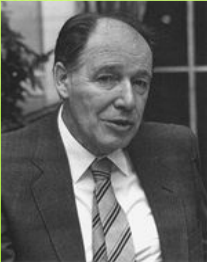
Хуан Хосе Линц 1926-2013

Хуан Линц типы политических режимов (на основе критериев их различий): демократический, авторитарный, тоталитарный, посттоталитарный, султанистский.