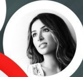
Злата Огневич Співачка