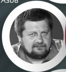
Ігор Мосійчук Екс-замкомандира батальйону "Азов"