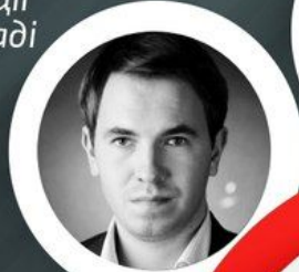
Андрій Лозовий Голова фракції РП у Київраді