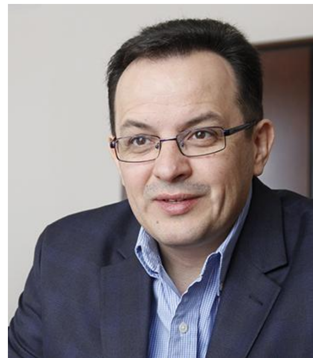
Керівник фракції Самопоміч у Верховній Раді - Олег Березюк.