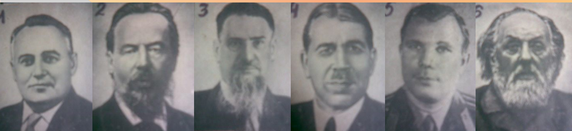
(1) Королёв (2) Попов (3) Курчатов (4) Вавилов 5) Гагарин (6) Циолковский

Кому посчастливилось первым побывать в космосе ?