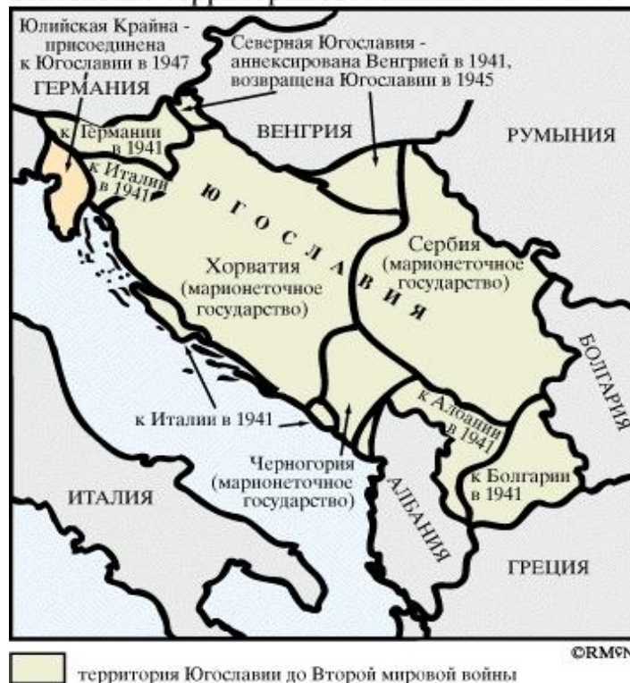
Изменение территории Югославии в 1941–1947

Подобно Чехословакии, Югославия была многонациональным государством. Господствующие позиции занимали сербы. Сильны были сепаратистские тенденции.