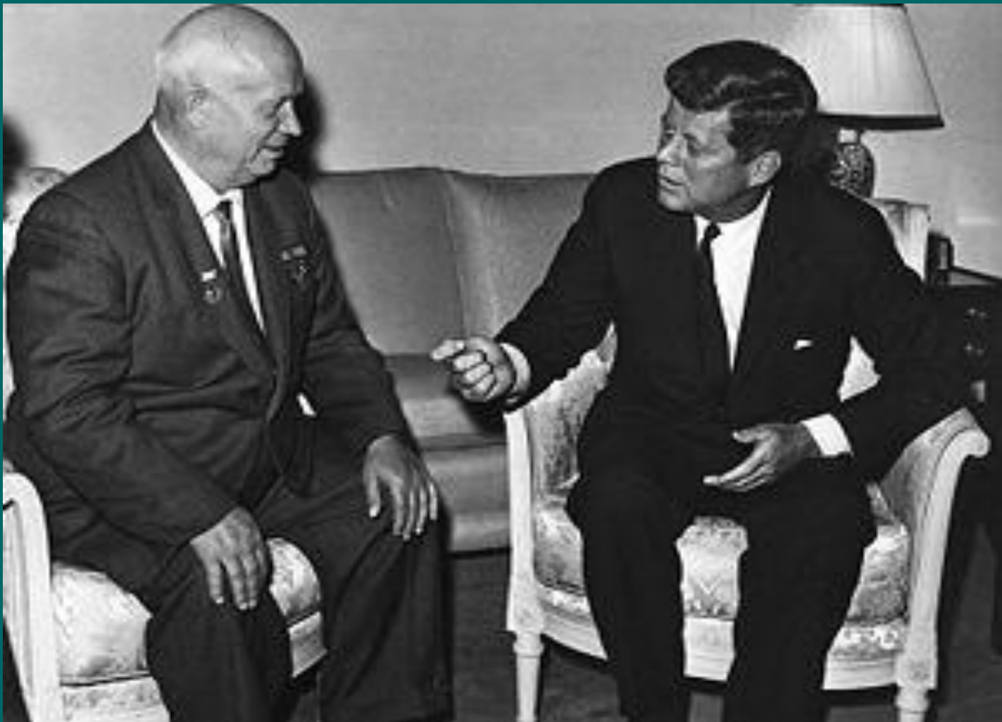
□ М.Хрущов і Д.Кеннеді