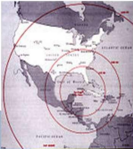
Радіус покриття ракет, дислокованих на Кубі

Карибська криза — надзвичайно напружене протистояння між Радянським Союзом і Сполученими Штатами відносно розміщення Радянським Союзом ядерних ракет на Кубі в жовтні 1962. Кубинці називають його «Жовтневою кризою» (ісп. Crisis de Octubre), в США поширена назва «Кубинська ракетна криза» (англ. Cuban missile crisis).