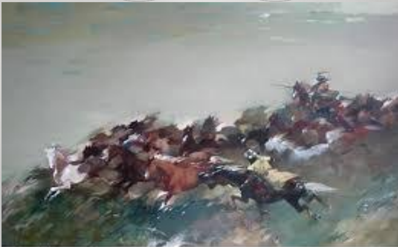
Айдар Жамсан. Барымта. 70x110 см. Харт, масло.