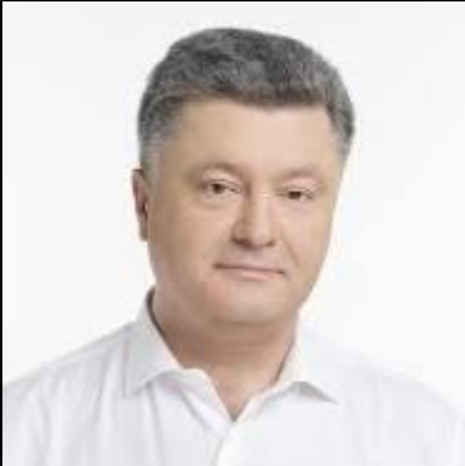
Петро Порошенко (1965)