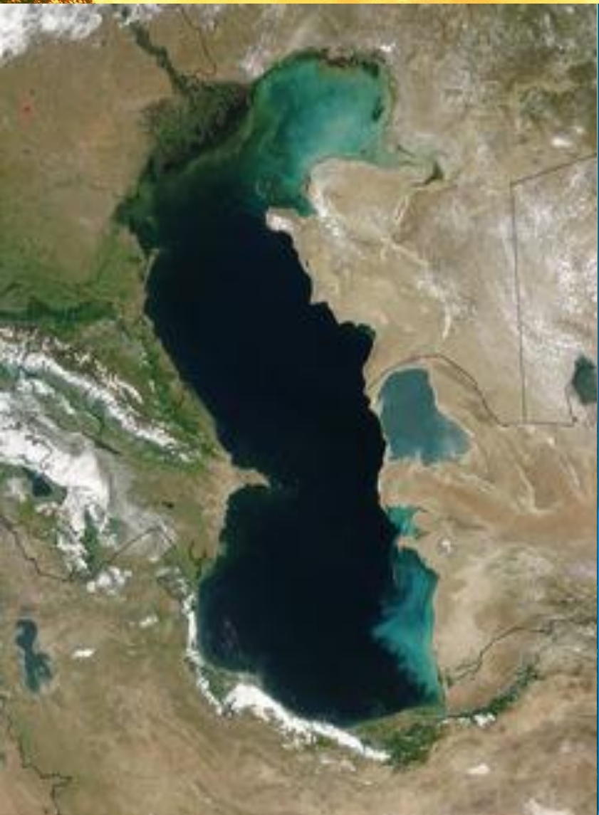
Каспийское море - озеро