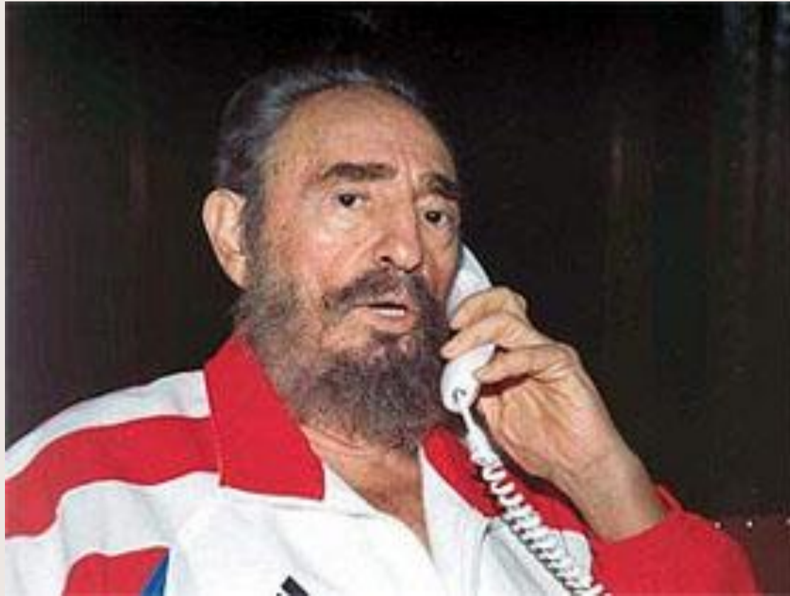
Фидель Кастро (Куба)