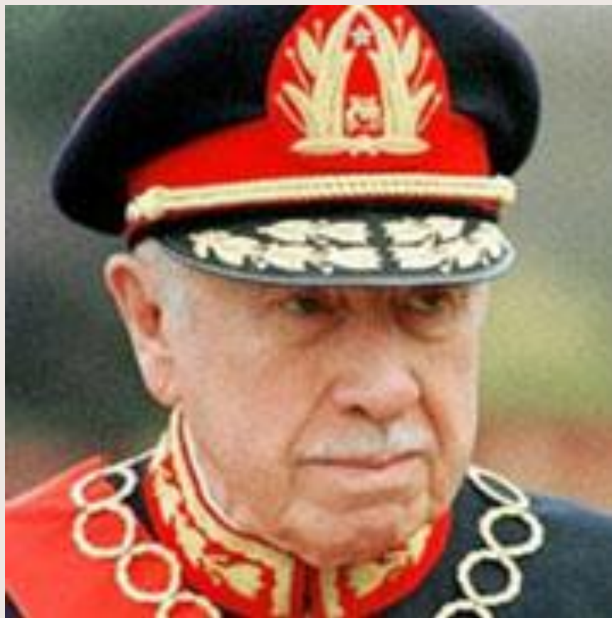
Аугусто Пиночет (Чили)