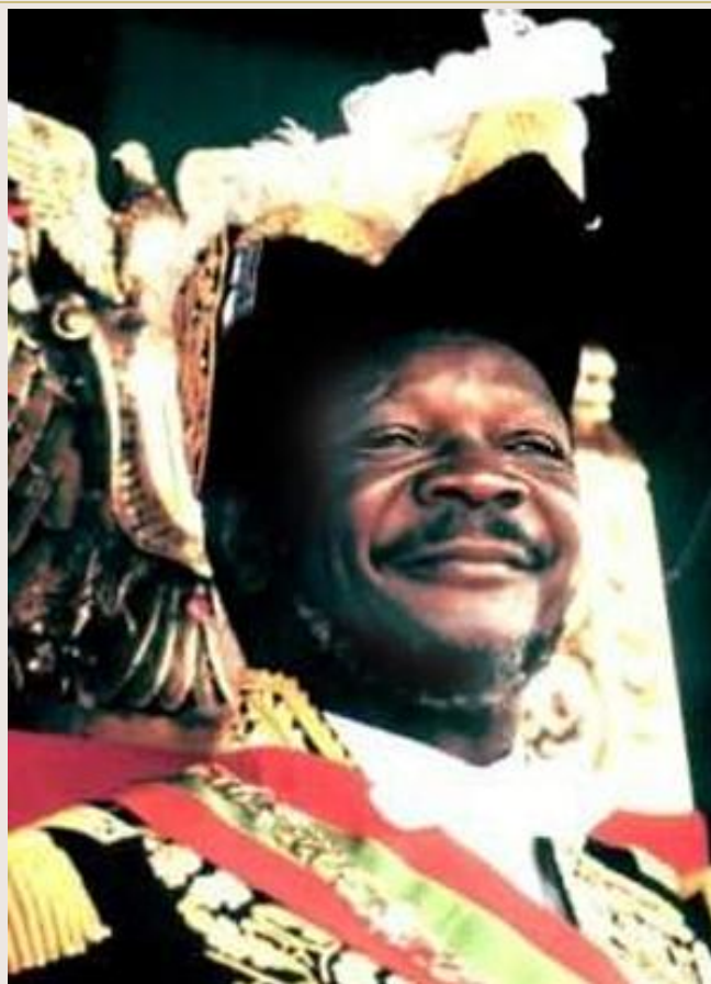
Жан Бедель Бокасса (Центрально-Африканская Империя)