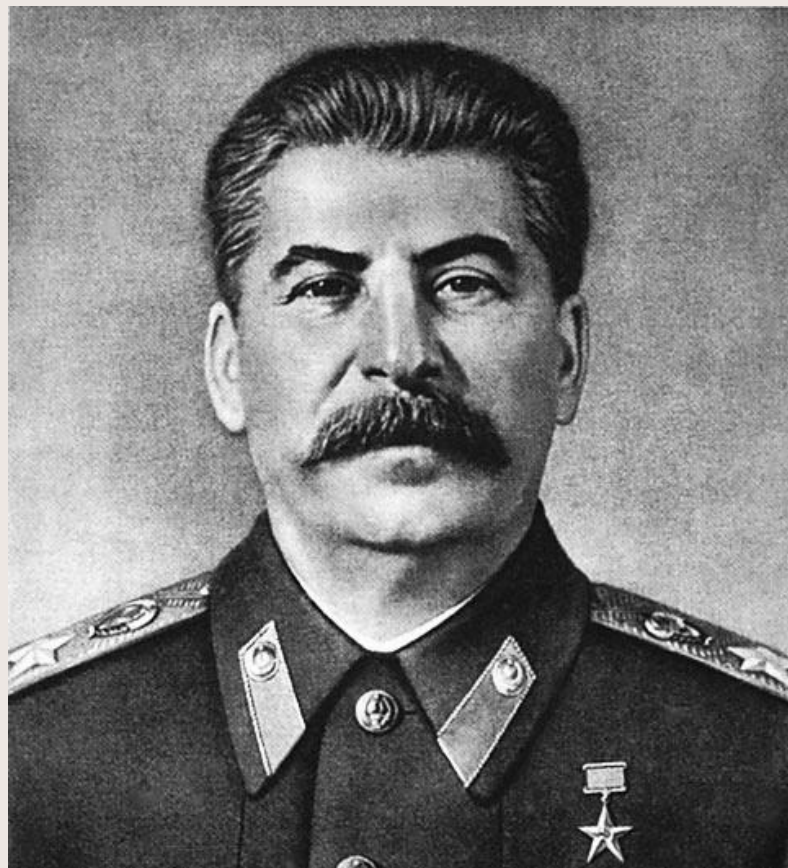
Иосиф Сталин (СССР)