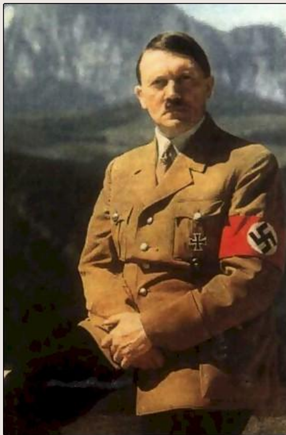
Адольф Гитлер (Германия)