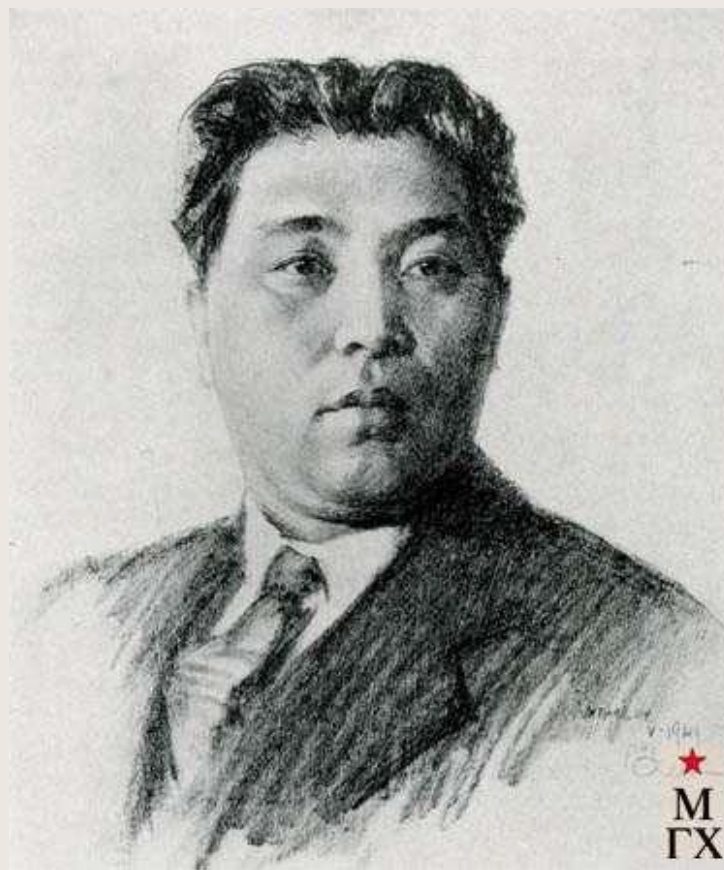
Ким Ир Сен (КНДР)