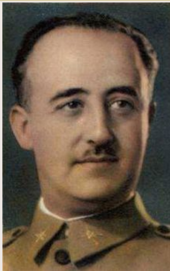
Франсиско Франко (Испания)