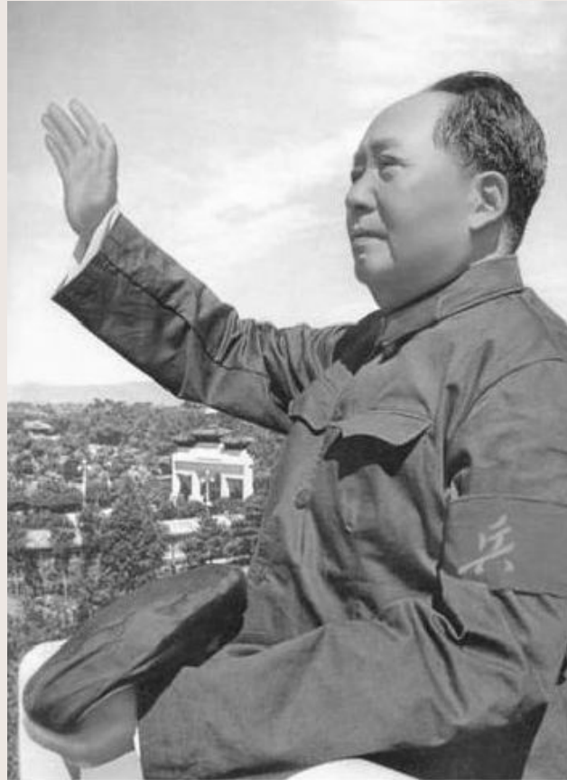
Мао Цзэдун (Китай)