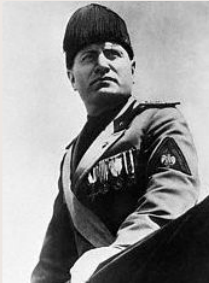
Бенито Муссолини (Италия)