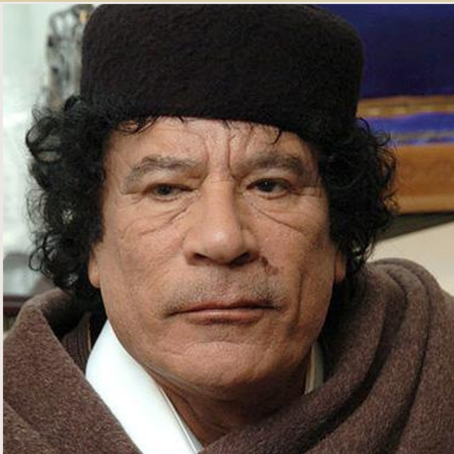
Муамар Каддафи (Ливия)