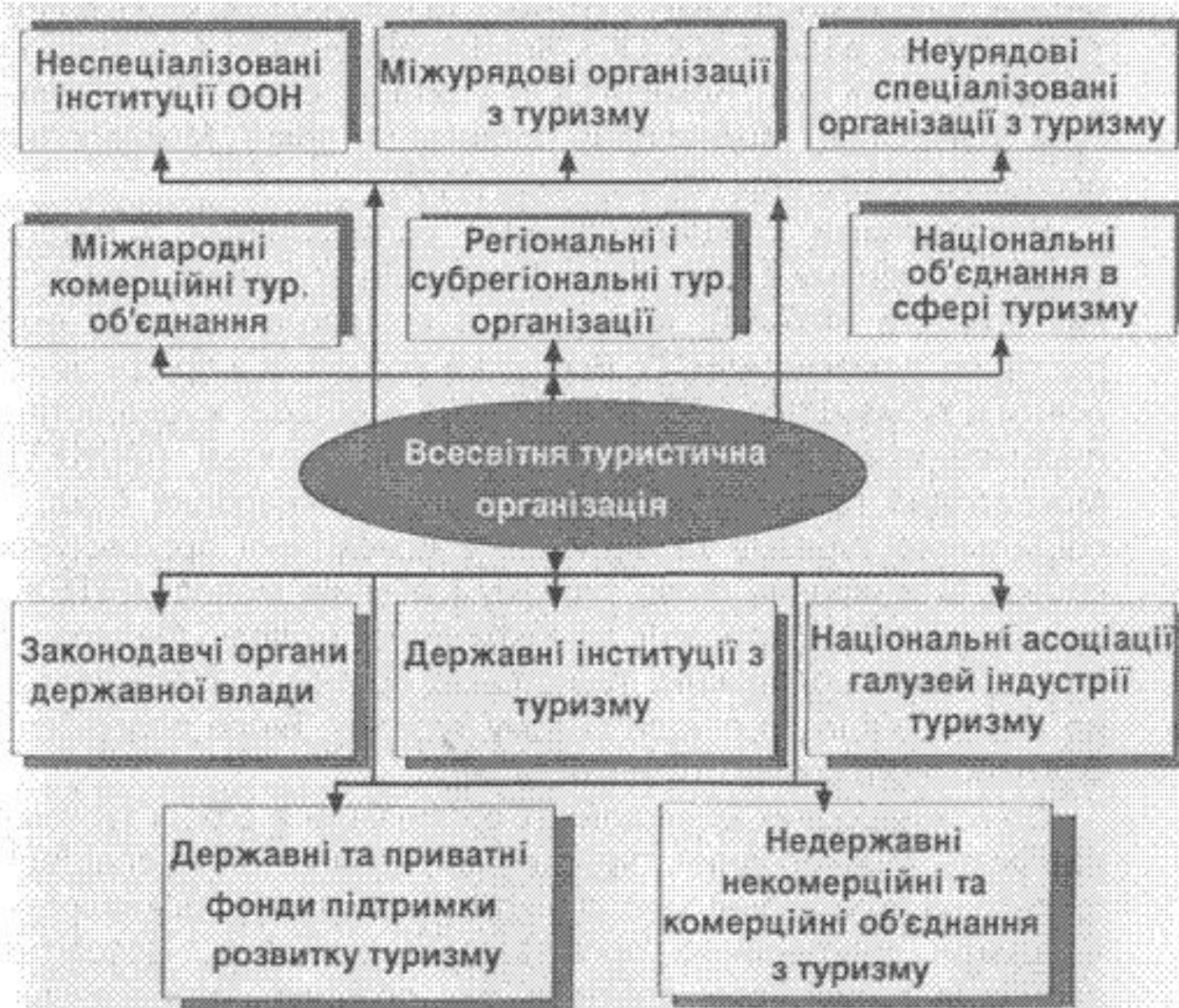
Мал. 3.28. Міжнародне співробітництво в сфері туризму.