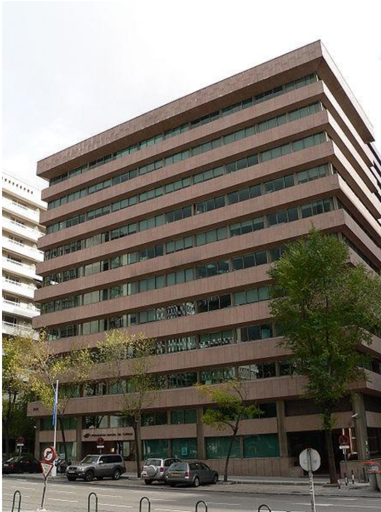
Штаб-квартира ЮНВТО, м. Мадрид

На підставі Конвенції між UNWTO й Іспанією про правовий статус організації в Іспанії, текст якої підписаний 10 листопада 1975 р. і ратифікований Іспанією 8 жовтня 1976 р. (конвенція набула чинності 2 червня 1977 р. і схвалена Генеральною асамблеєю UNWTO 31 травня 1977 р.), штаб-квартиру UNWTO 1 січня 1976 р. було перенесено з Женеви до Мадрида.