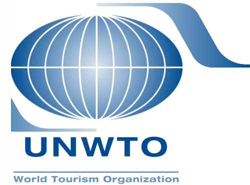
Рис. 4.1. Організаційна структура UNWTO