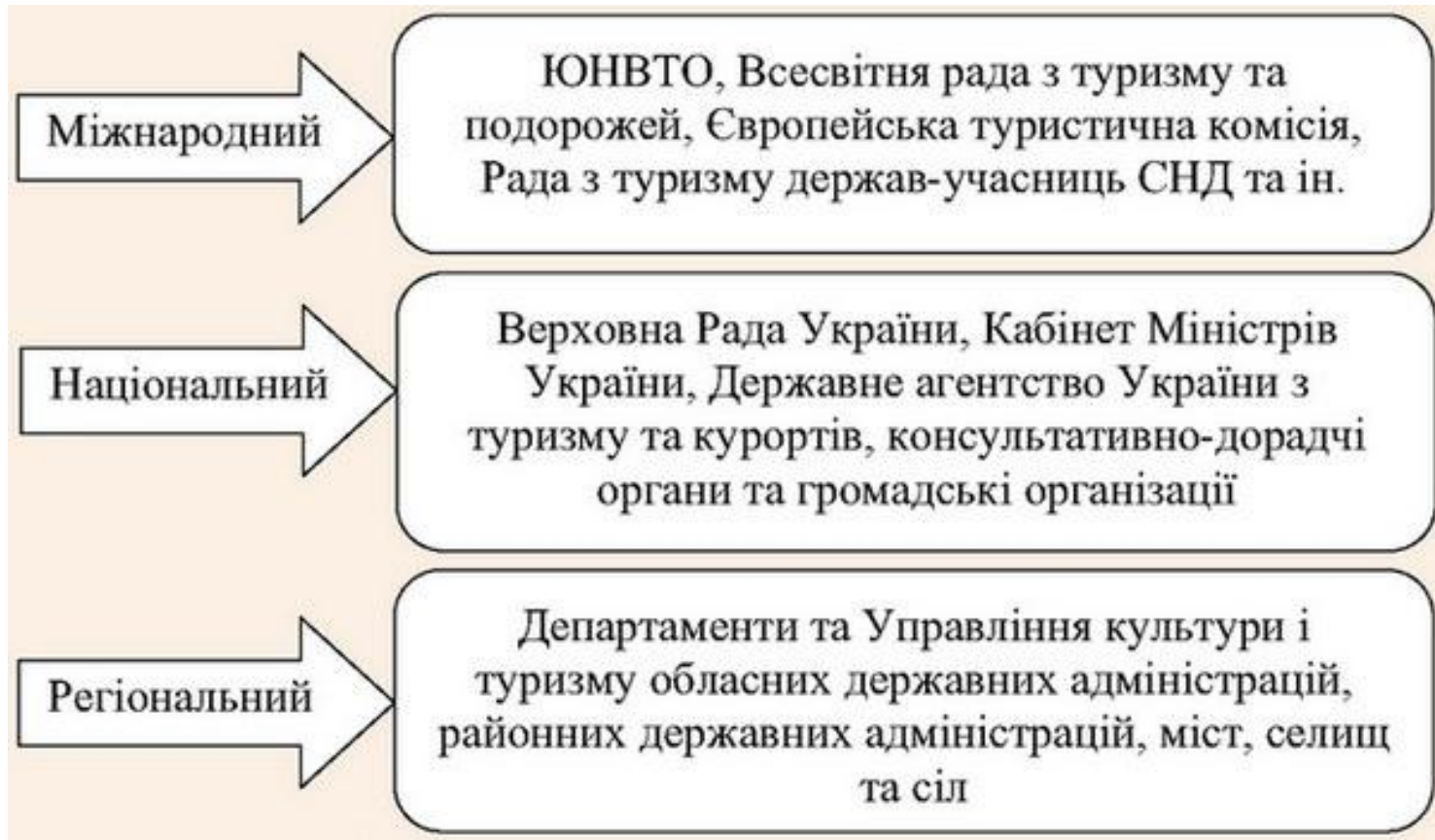
Рис. 1. Рівні формування та реалізації туристичної політики держави