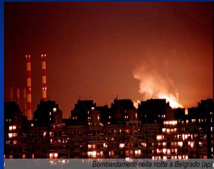
Bombardamenti nella notte a Belgrado

Руководство России осудило эти действия как агрессию и потребовало созыва Совета Безопасности ООН. Были прерваны отношения России с НАТО.