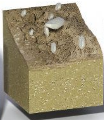
Опасные склоновые процессы