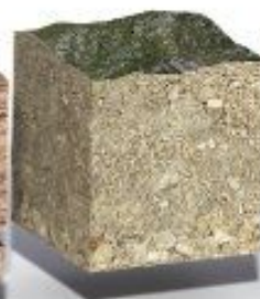
Специфические и слабые грунты