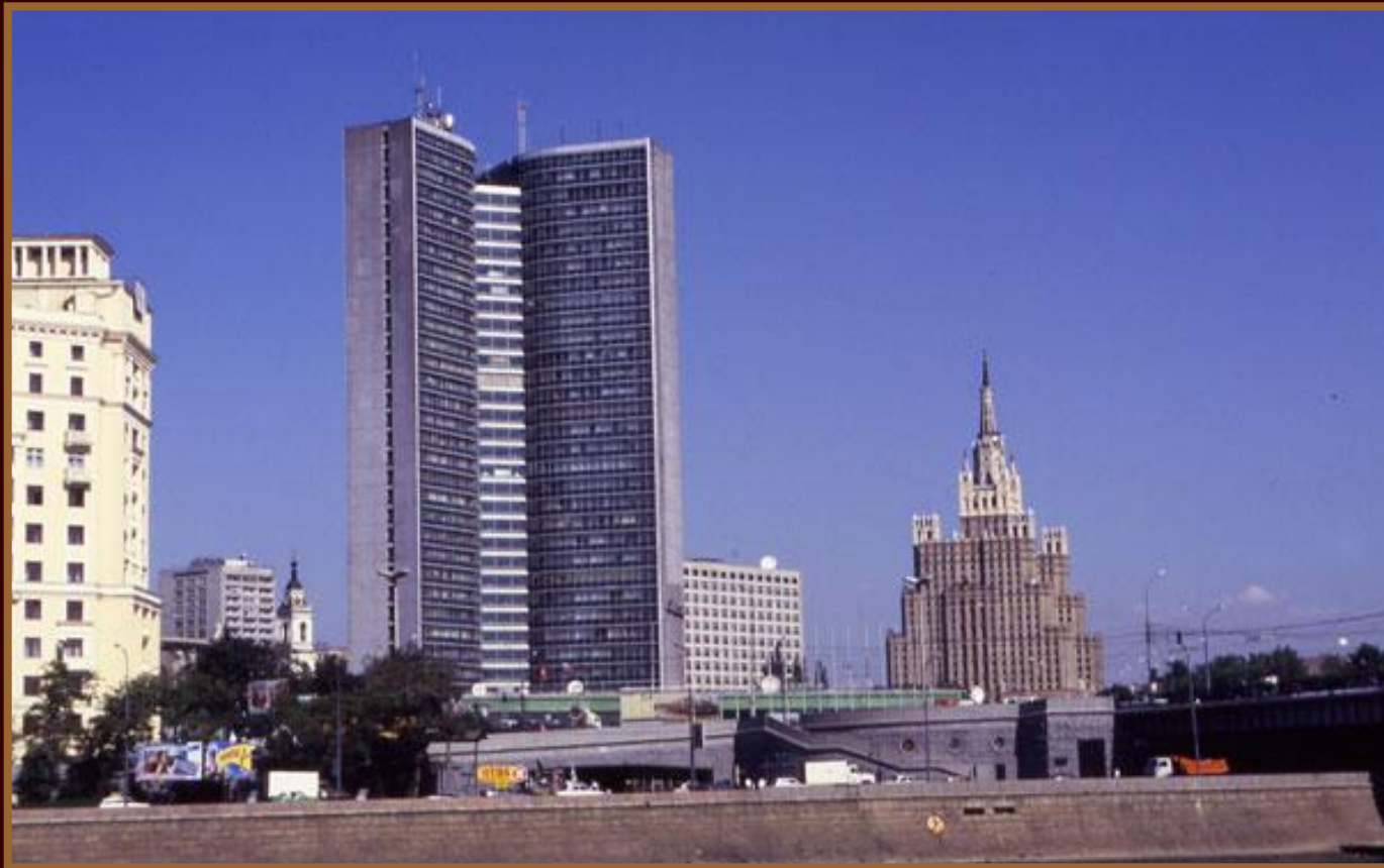
Москва. Здание СЭВ

25 января 1949 г. – создание Совета экономической взаимопомощи (СЭВ)