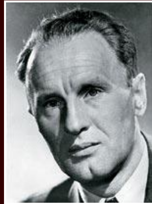
Имре Надь. Лидер реформистов. Премьер-министр

В начале 60-х г.г. стала заявлять о своей самостоятельности Румыния. Порвала связи с СССР Албания.