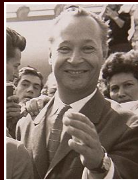
Александр Дубчек Первый секретарь ЦК КПЧ (январь- август 1968 г.)