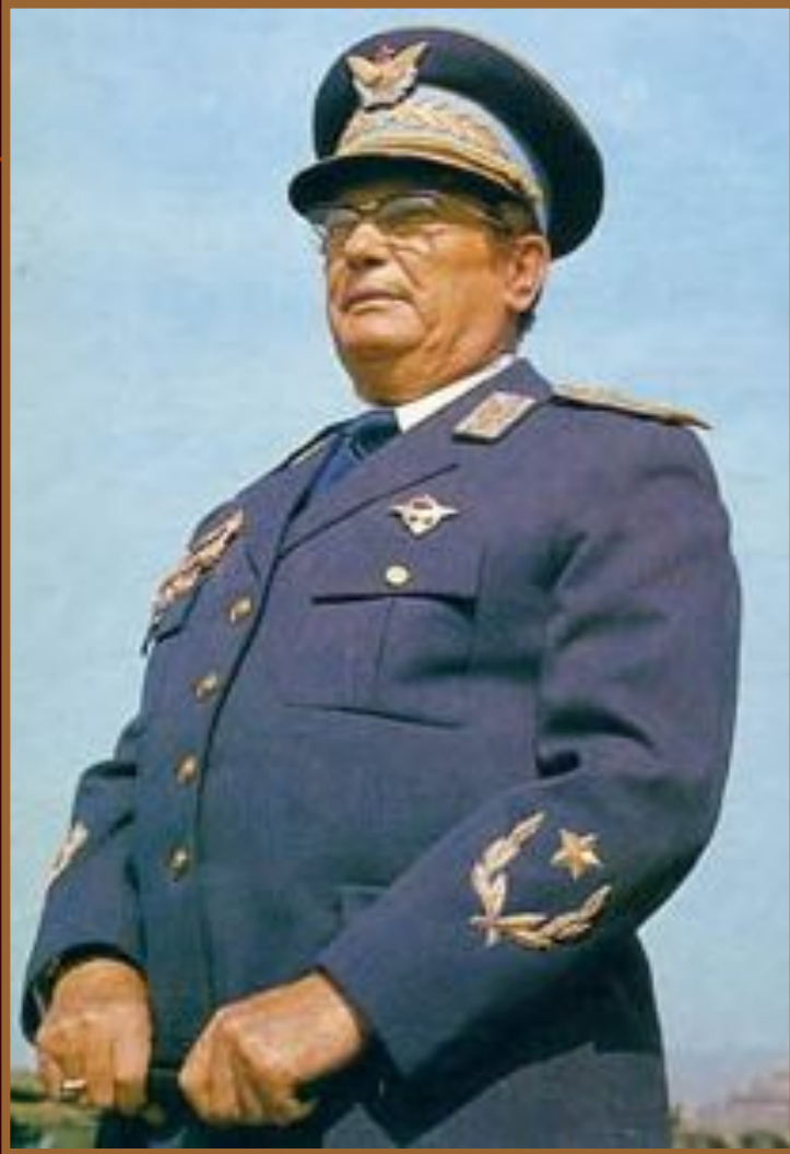
Иосип Броз Тито. Президент СФРЮ