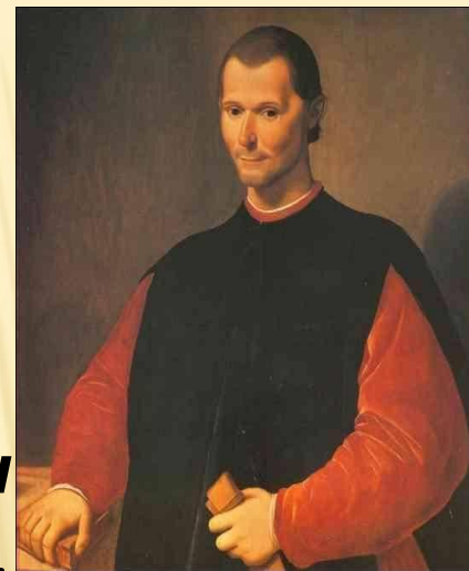
Никколо Макиавелли (1469—1527) итальянский мыслитель

«Излишне говорить сколь похвальна в государстве верность данному слову, прямодушие и неуклонная честность. Однако мы знаем по опыту, что в наше время великие дела удавались лишь тем, кто не старался сдержать данное слово и умел, кого нужно, обвести вокруг пальца... Следует понимать, что государь, особенно новый, не может исполнять все то, за что людей почитают хорошими, так как ради сохранения государства он часто бывает вынужден идти против своего слова, против милосердия... Поэтому в душе он всегда должен быть готов к тому, чтобы переменить направление, если события примут другой оборот..., то есть, как было сказано, по возможности не удаляться от