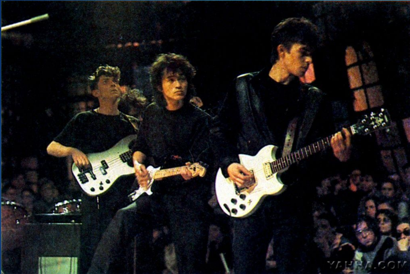
Виктор Цой и группа "Кино".

"Перемен! - требуют наши сердца. Перемен! - требуют наши глаза."