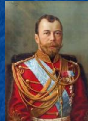
Николай II 17 октября 1905 г.