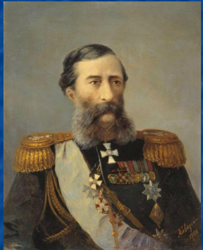
М. Т. Лорис – Меликов 1881 г.