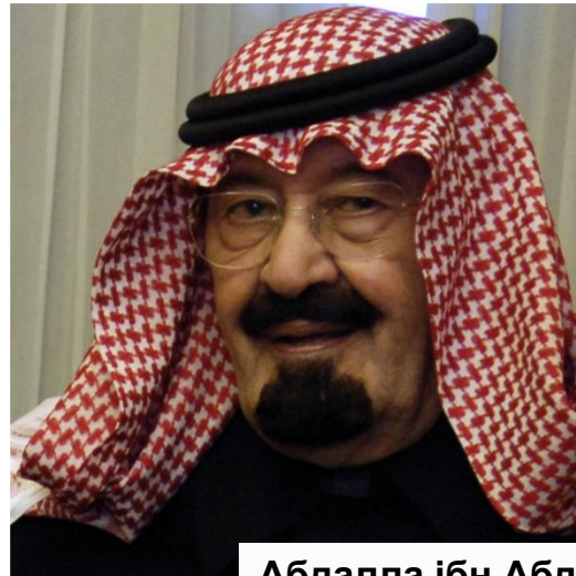
Абдалла ібн Абдель Азіз ас-Сауд король Саудівської Аравії