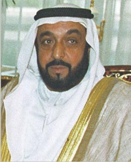
Халіфа бін Заїд аль Нахайян президент Об'єднаних Арабських Еміратів (Один з найбагатших людей світу за даними журналу Forbes ).