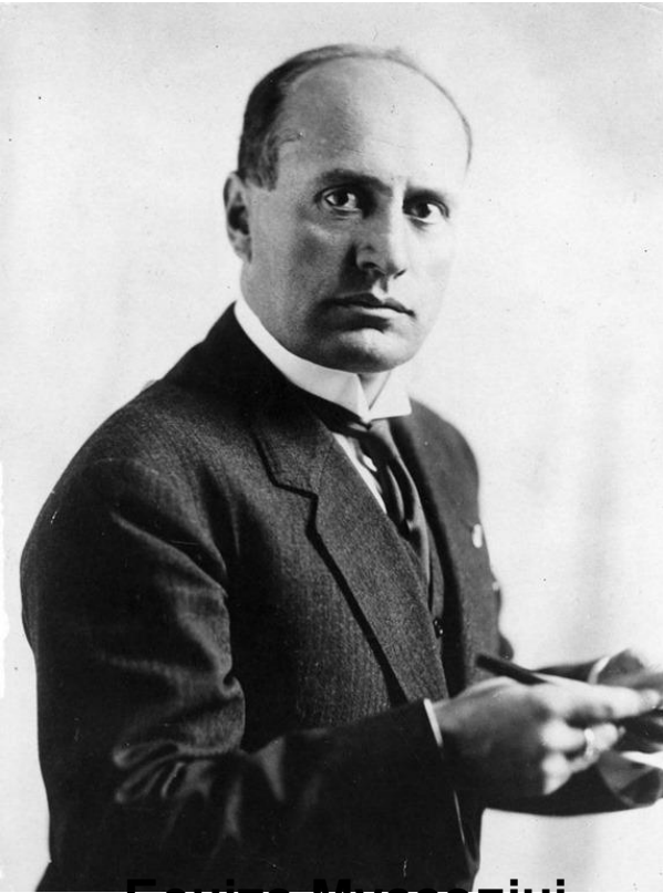
Беніто Муссоліні фашистський диктатор Італії