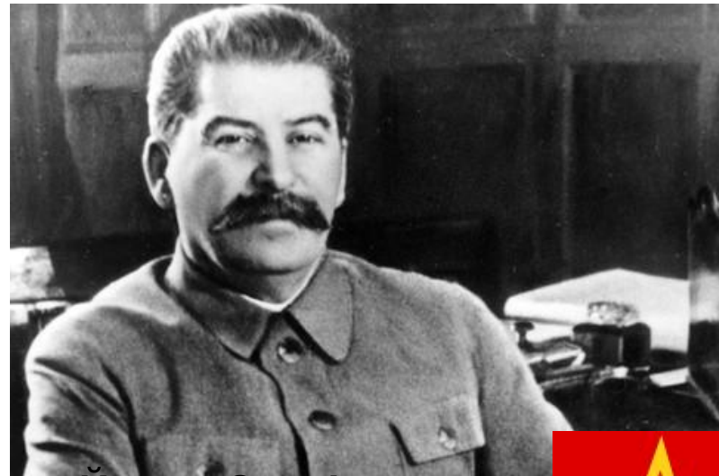
Йосип Сталін Колишній Голова Ради Міністрів СРСР

Тоталітаризм — система державно-політичної влади, яка регламентує усі суспільні та приватні сфери життя людини-громадянина і не визнає автономії від держави таких недержавних сфер людської діяльності як економіка і господарство, культура, виховання, релігія.