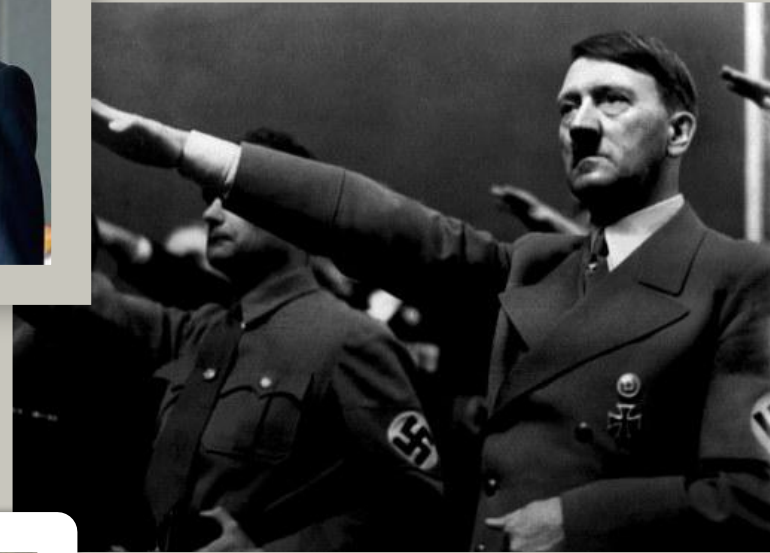
Гітлер А. Рехканцлер Німеччини 1933-1945