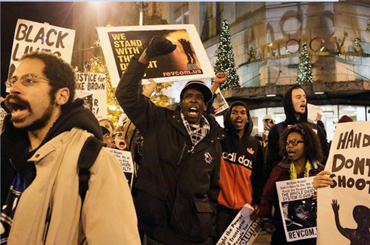
Бастующие на улицах США

Поводом для первых массовых столкновений в июле 1964 года стало убийство нью-йоркским полицейским Джелигеном 15-летнего чернокожего. В ту же ночь в результате вспыхнувших беспорядков было ранено 140 и арестовано 520 человек, а спустя год еще одно убийство полицейским жителя Гарлема также повлекло волнения.