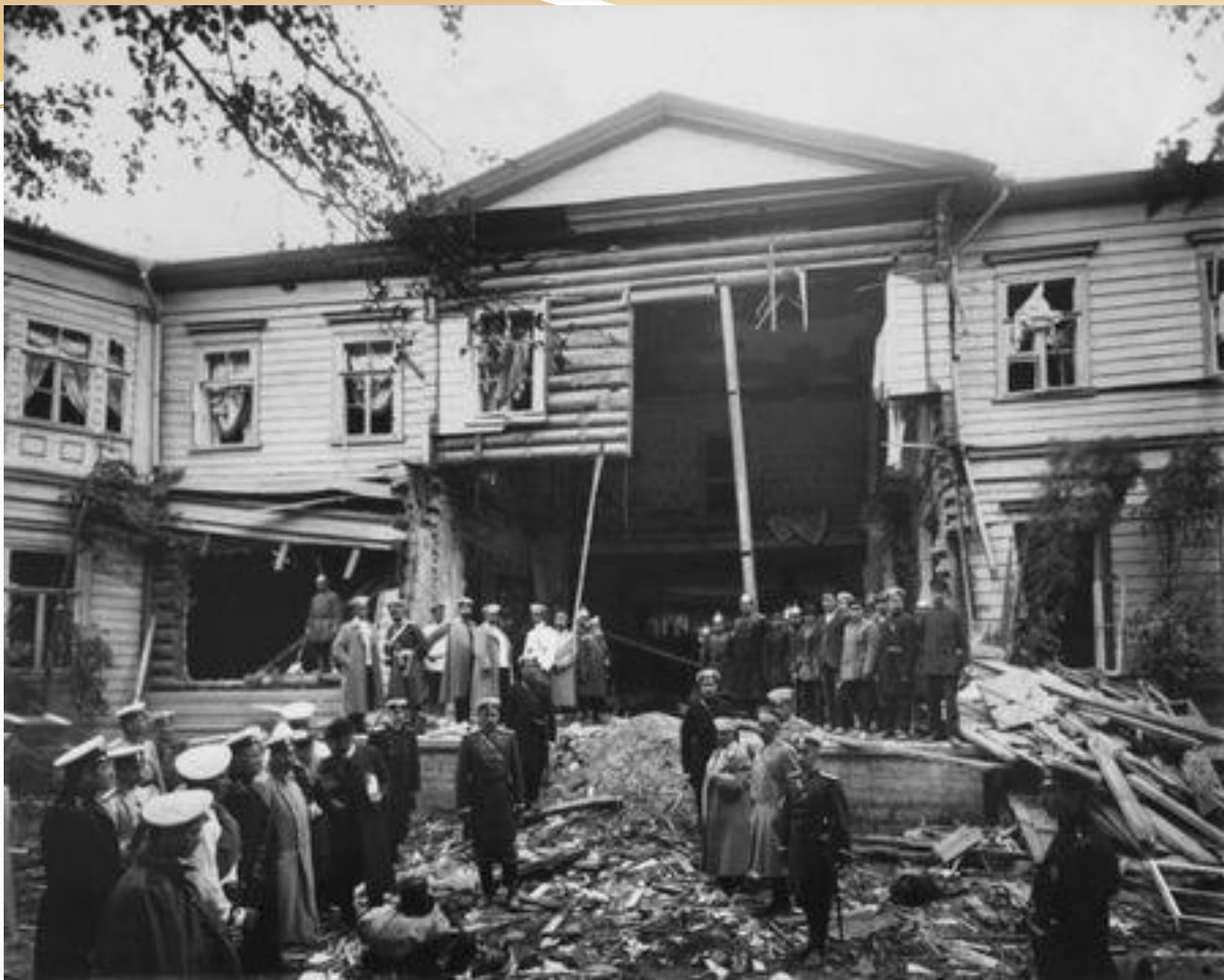
Дача Столыпина после взрыва. Август 1906 г.