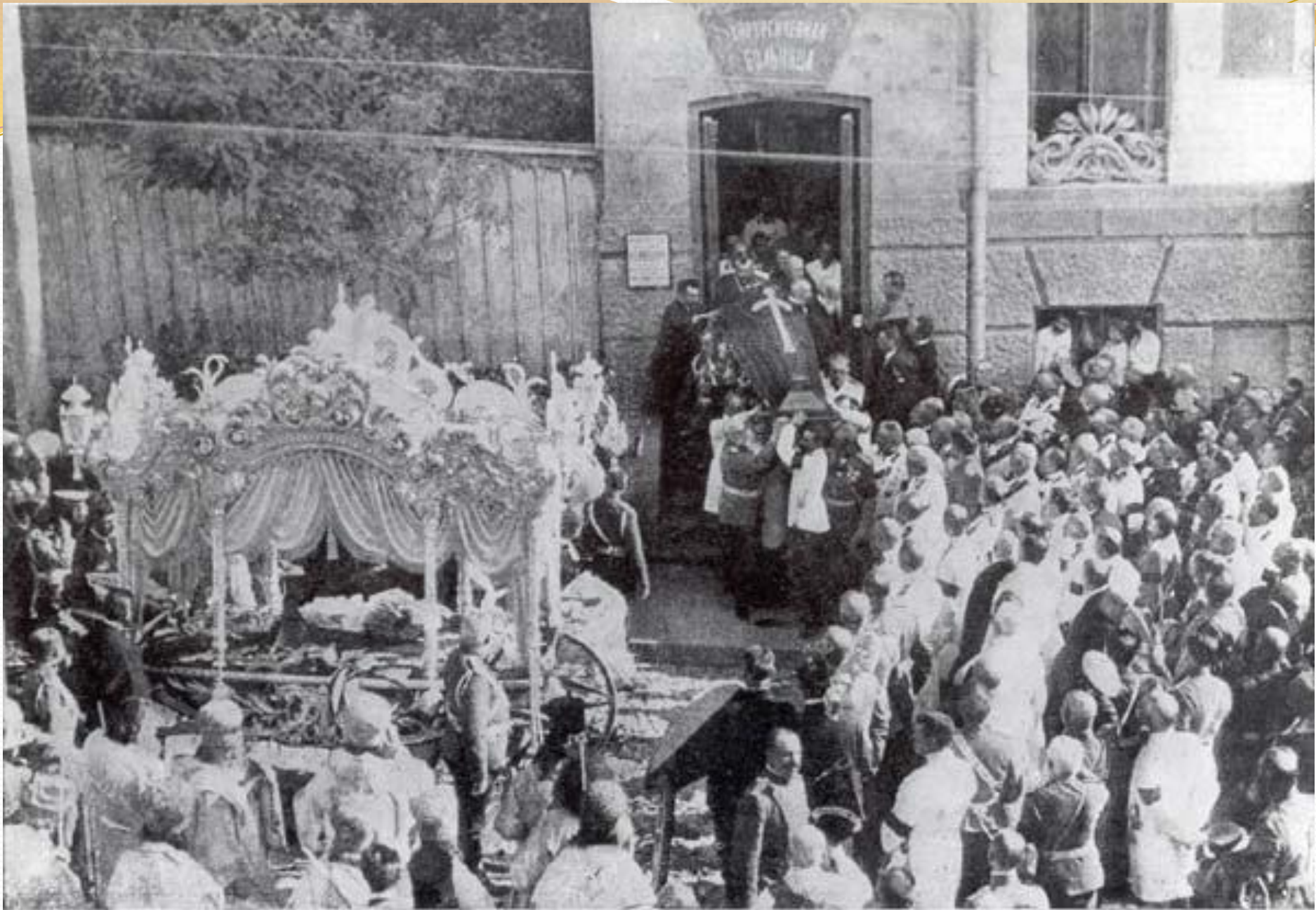
Винось тѣла П. А. Столыпина изъ больницы бр. Маковскихъ.