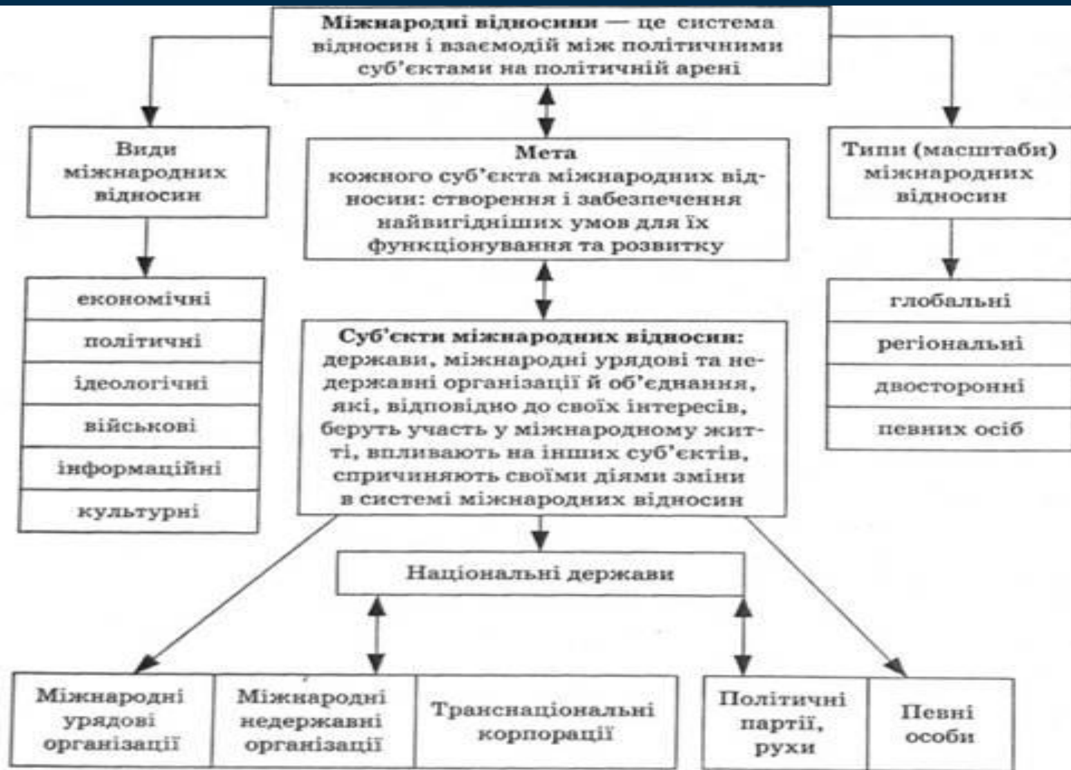
Рис. 15.2. Мета, види та масштаби міжнародних відносин